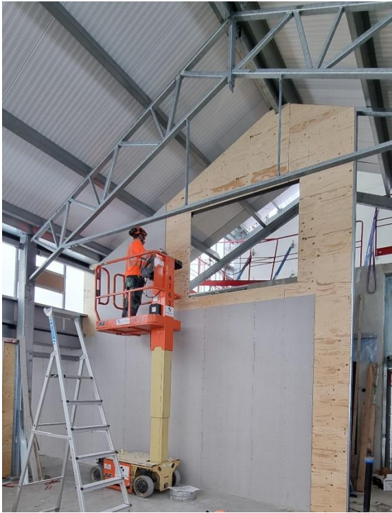
Figur 2. Montering av innervägg plan 3