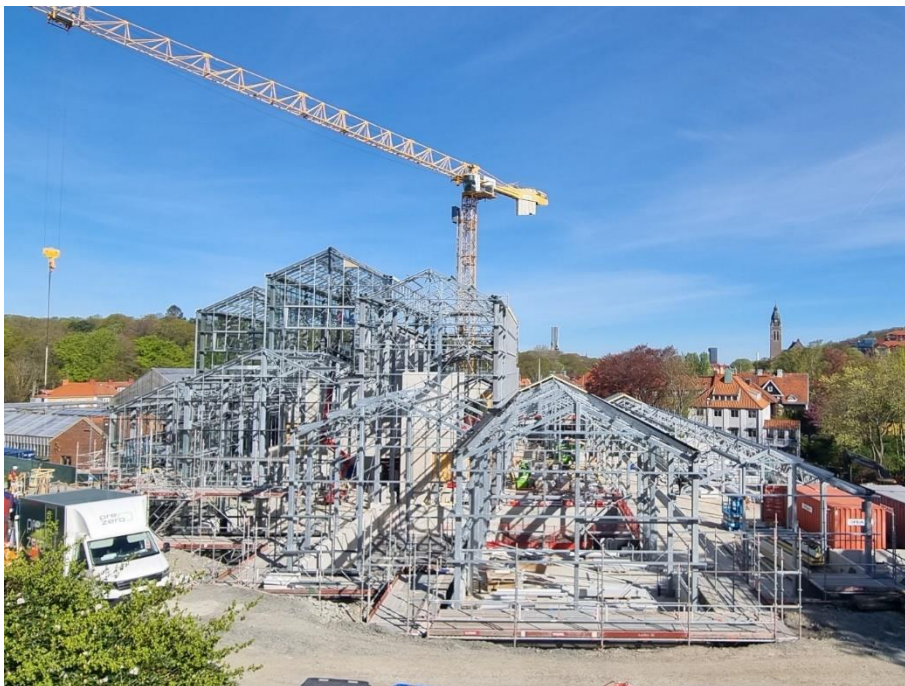
Figur 1. Översiktsbild arbetsområde etapp 2

Under de kommande veckorna kommer växthusentreprenören att montera glastak på växthuset. Parallellt med detta fortsätter arbete med detaljer och glasfasad. Invändiga arbeten fortsätter och innerväggar, installationer och vissa ytskikt utförs på plan 2 och 3. Under kommande två veckor ska montering av hissar påbörjas.