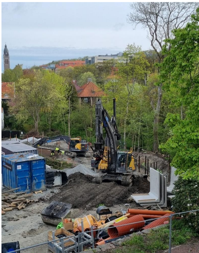
Figur 57. Pågående schakt- och pålningsarbete i öster