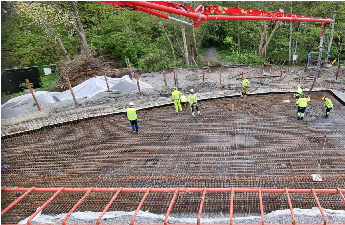
Figur 46. Pågående gjutning av bottenplatta tankar

Utvändigt byggs konstruktion för bottenplatta till tankar. Arbeta med utvändiga betongkonstruktioner pågår och onsdag den 30/4 sker gjutning av bottenplatta under tankar. Arbetet medför backande betongbilar på Malmgårdsgatan.