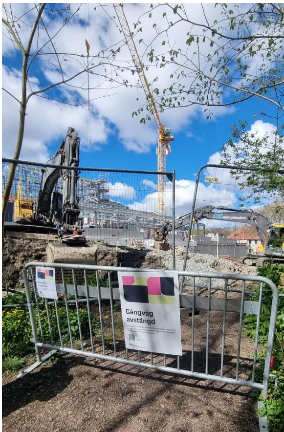
Figur 810. Avstängning stig vid entré Askimsgatan till Vitsippsdalen