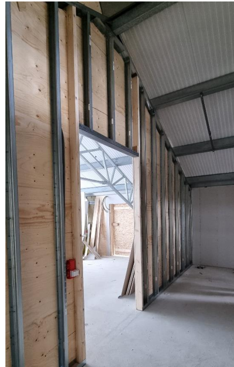
Figur 3. Påbörjad innervägg plan 3