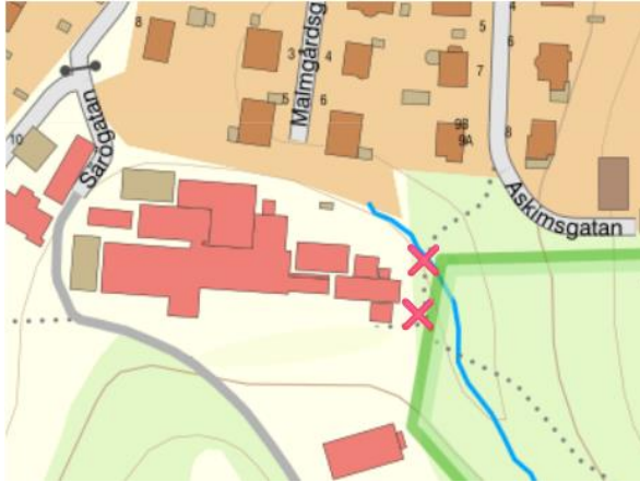
Figur 79. Översiktskarta avstängning stig Vitsippsdalen

Under vecka 15 till och med vecka 33 kommer stigen mellan Askimsgatan och naturreservatet Vitsippsdalen att stängas av, se bild nedan. Detta beror på omläggning av stigen samt byggnation av gabionmur. Markarbetena sker ej i naturreservatet.