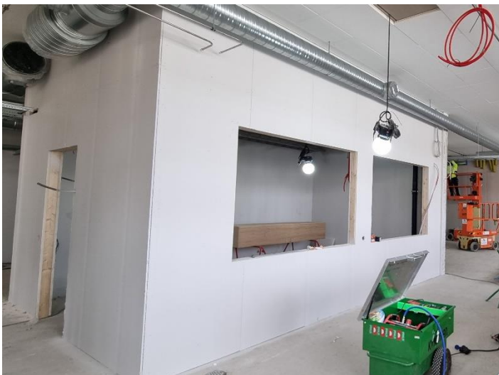
Figur 4. Blivande mötesrum plan 2