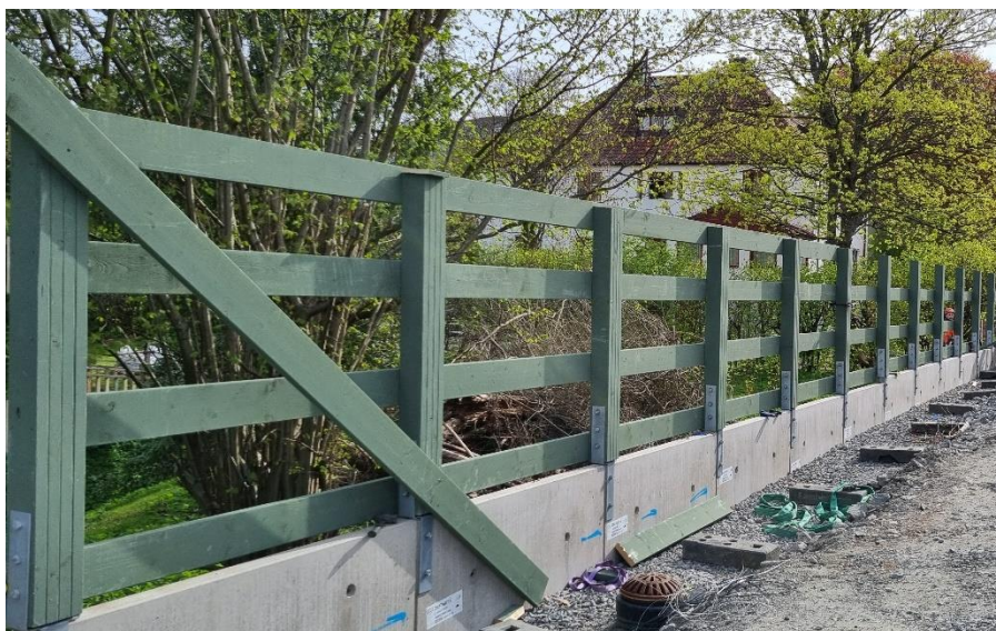
Figur 68. Pågående byggnation av plank

Arbete med montering av plank på L-stöd pågår.