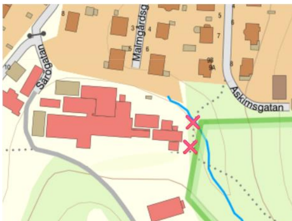
Bild 4. Avstängning stig vid entré Askimsgatan till Vitsippsdalen

Under vecka 15 till och med vecka 33 kommer stigen mellan Askimsgatan och naturreservatet Vitsippsdalen att stängas av, se bild nedan. Detta beror på omläggning av stigen samt byggnation av gabionmur. Markarbetena sker ej i naturreservatet.