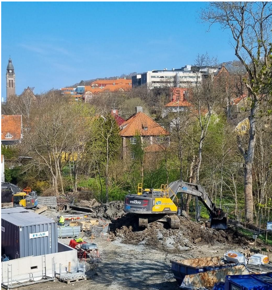
Bild 2. Pågående schakt- och pålningsarbete i öster

Schakt- och pålningsarbete pågår för att förbereda östra sidan där det skall grävas ner tankar, byggas gabionmurar och en ny försörjningsväg. Schaktarbetet medför att lastbilar körs in/ut via Fanny Gréns väg/Särögatan tidvis i hög frekvens. Nästa etapp av pålningsarbete beräknas börja vecka 17. Arbetet sker etappvis fram till sommaren. Både pålnings- och schaktarbetena medför höga ljud och vibrationer från arbetsplatsen.