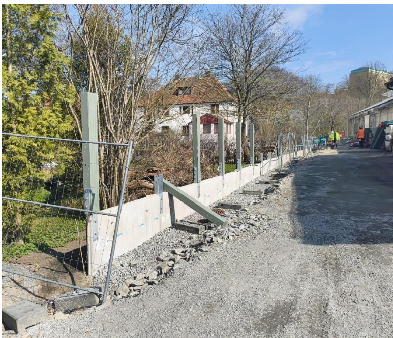
Bild 3. Pågående byggnation av plank