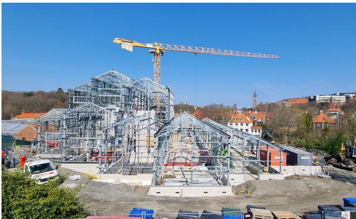
Bild 1. Översiktsbild arbetsområde etapp 2

Arbete med montering av glas, profiler och detaljer som tätar huset fortgår. På plan 3 förbereder man för golvvajämning samt byggnation av innerväggar. Utöver det pågår installationsarbete i hela huset.