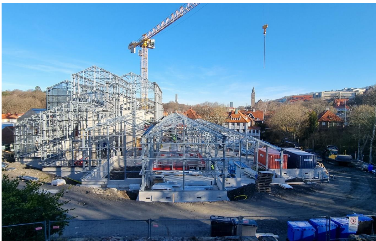
Bild 1. Översiktsbild arbetsområde etapp 2

Från och med vecka 15 kommer snurrgrind till arbetsplatsen att vara placerad vid bakomytorna vid verkstaden.