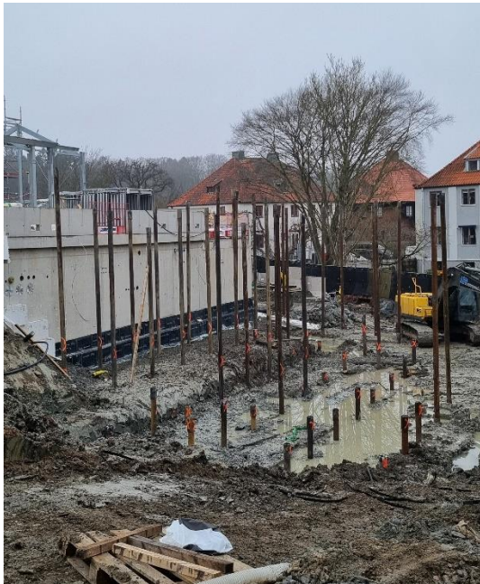
Bild 2. Pågående schakt- och pålningsarbete i öster

Schakt- och pålningsarbete pågår för att förbereda östra sidan där det skall grävas ner tankar, byggas gabionmurar och en ny försörjningsväg. Schaktarbetet medför att lastbilar körs in/ut via Fanny Gréns väg/Särögatan tidvis i hög frekvens. Pålningsarbete pågår och sker etappvis fram till sommaren. Både pålnings- och schaktarbetena medför höga ljud och vibrationer från arbetsplatsen.