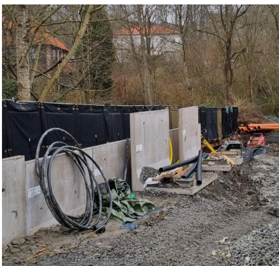
Bild 3. Monterade L-stöd i tomtgräns.

Med start vecka 15 påbörjas montering av plank på L-stöd. Arbetet inleds i höjd med verkstaden och fortsätter i riktning mot Malmgårdsbron.