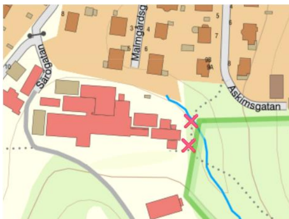
Bild 4. Avstängning stig vid entré Askimsgatan till Vitsippsdalen

Under vecka 15 till och med vecka 33 kommer stigen mellan Askimsgatan och naturreservatet Vitsippsdalen att stängas av, se bild nedan. Detta beror på omläggning av stigen samt byggnation av gabionmur. Markarbetena sker ej i naturreservatet.