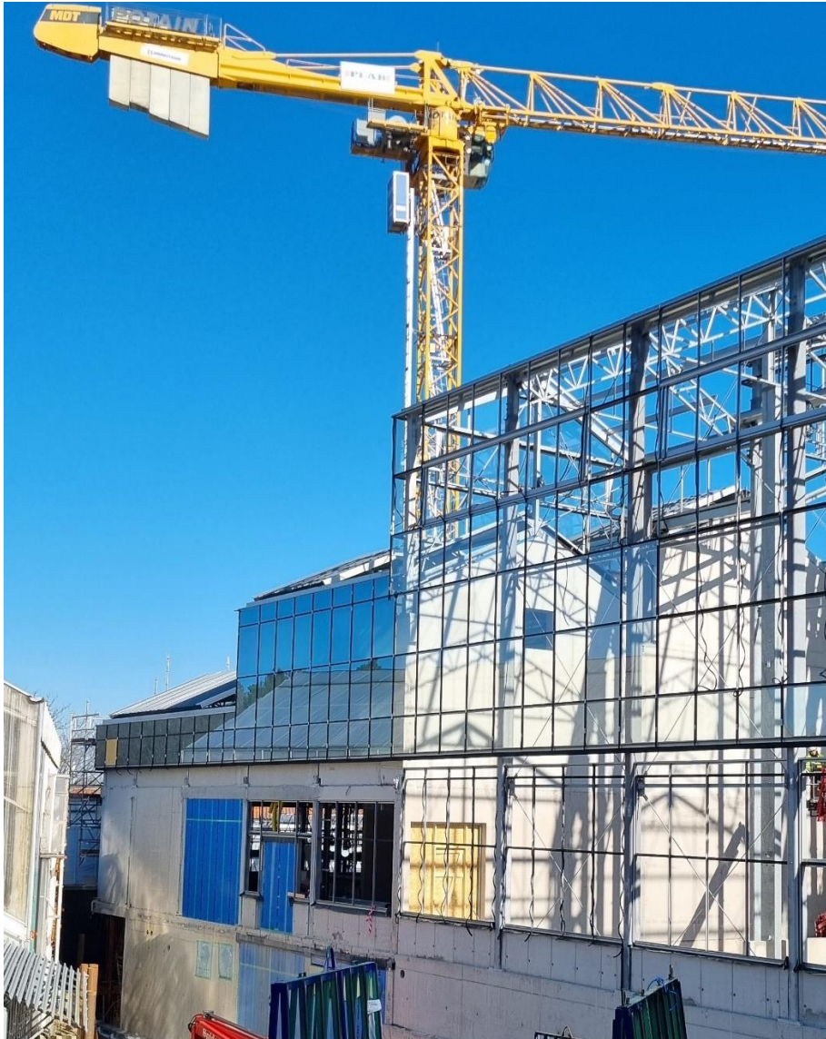
Bild 2. Glasning av fasad mot Fanny Gréns väg påbörjad