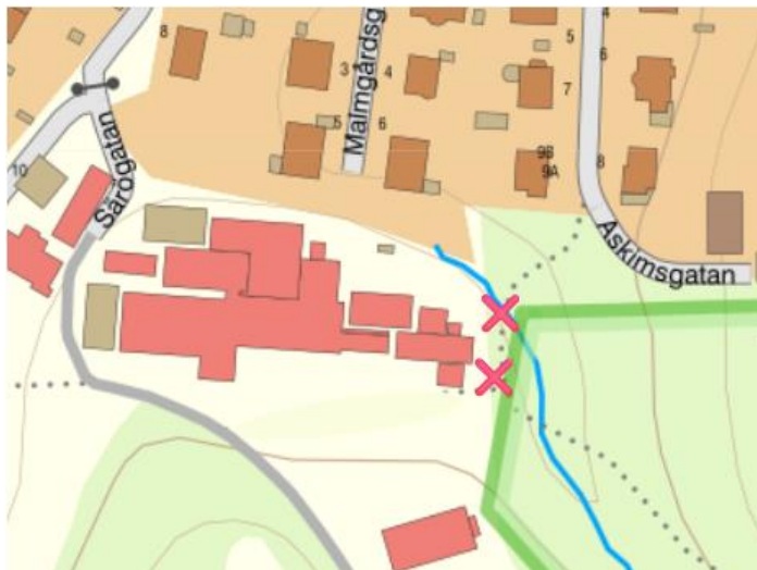
Bild 4. Avstängning stig vid entré Askimsgatan till Vitsippsdalen

Under vecka 15 till och med vecka 33 kommer stigen mellan Askimsgatan och naturreservatet Vitsippsdalen att stängas av, se bild nedan. Detta beror på omläggning av stigen samt byggnation av gabionmur. Markarbetena sker ej i naturreservatet.