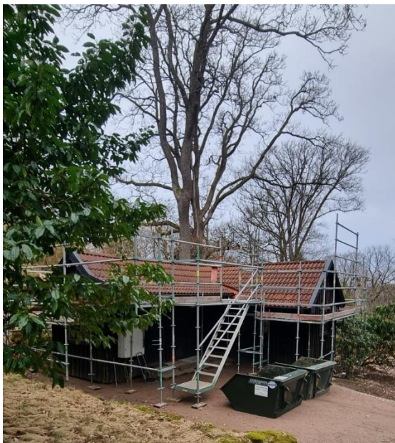
Bild 6. Alpstugan.

Arbetet kommer inte ha nämnvärd påverkan för varken verksamhet eller besökare mer än det oväsen ett takbyte medför (ljud från att spika/hamra, såga, kasta tegelpannor i container m.m.).