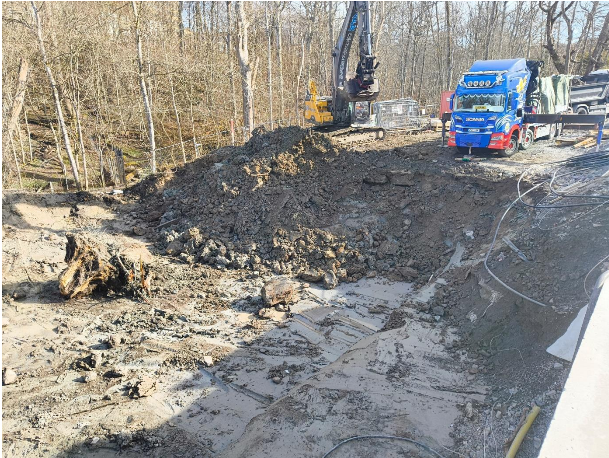
Bild 3. Pågående schaktarbete i öster