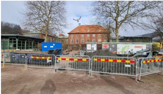
Bild 5. Pågående markarbeten för kommande elkanalisation i huvudentréområdet

dagtid, måndag-fredag och beräknas pågå fram till vecka 14. Mindre arbetsområden kommer temporärt att spärras av för att minska skaderisk på obehöriga. Det blir ingen nämnvärd påverkan för omkringliggande verksamhet eller besökare.