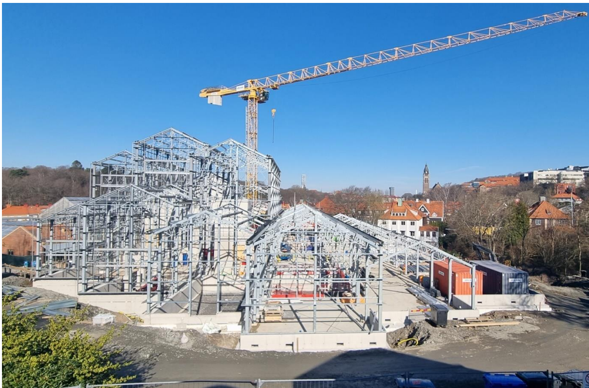
Bild 1. Översiktsbild arbetsområde etapp 2

Växthusmontage pågår fortsatt med flera olika aktiviteter så som glasning, takläggning, aluminiumprofiler och stålstomme. Detta arbete kräver en stor mängd material som transporteras till arbetsplatsen via Särögatan. Detta medför större frekvens av transporter än vanligt. Installationsarbete pågår nu parallellt både på plan 1 och plan 2. Kommande arbeten är montering av innerväggar på plan 2.