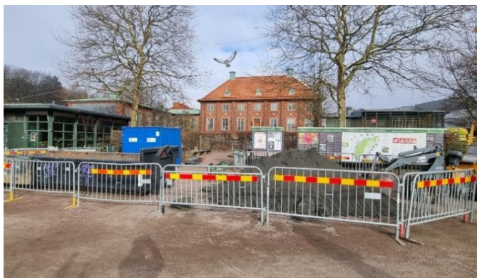
Bild 5. Pågående markarbeten för kommande elkanalisation i huvudentréområdet

Markarbeten i huvudentréområdet pågår för att möjliggöra nya el-matningar och el-kanalisationer till belysningsarmaturer som finns spritt i Botaniska Trädgårdens huvudentréområde. Arbetet sker både med grävmaskin och för hand. Arbetet pågår dagtid, måndag-fredag och beräknas pågå ca 6 veckor. Mindre arbetsområden kommer temporärt att spärras av för att minska skaderisk på obehöriga. Det blir ingen nämnvärd påverkan för omkringliggande verksamhet eller besökare.