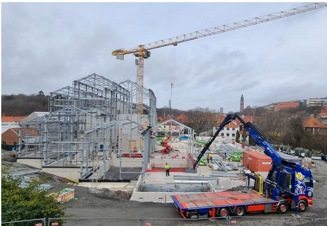
Bild 1. Översiktsbild arbetsområde etapp 2

Växthusmontage pågår nu med flera olika aktiviteter så som glasning, takläggning, aluminiumprofiler och stålstomme. Kommande veckor är det full fart på glasmonteringen och parallellt med detta kommer även nästa skepp att få sina stålpelare monterade. Installationer på plan 1 pågår och kommande veckor börjar installatörerna förflytta sig upp till plan 2 för att fortsätta sitt arbete där.