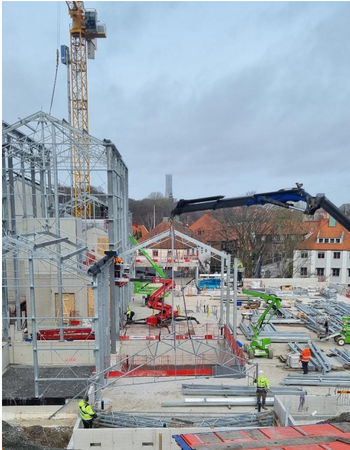
Bild 2. Pågående arbete med montering takstol

Med start preliminärt vecka 14 påbörjas pålningsarbete inför grundläggning av betongplatta för tankar. Detta kommer att medföra höga ljud och vibrationer från arbetsplatsen. Pålningsarbeten kommer pågå fram till sommaren 2025.