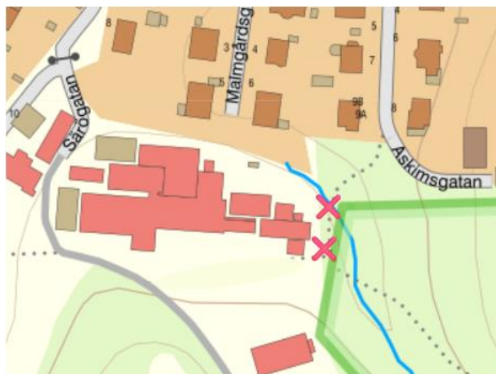
Bild 4. Avstängning stig vid entré Askimsgatan till Vitsippsdalen

Under vecka 15 till och med vecka 33 kommer stigen mellan Askimsgatan och naturreservatet Vitsippsdalen att stängas av, se bild nedan. Detta beror på omläggning av stigen samt byggnation av gabionmurar. Markarbetena sker utanför naturreservatets gräns.