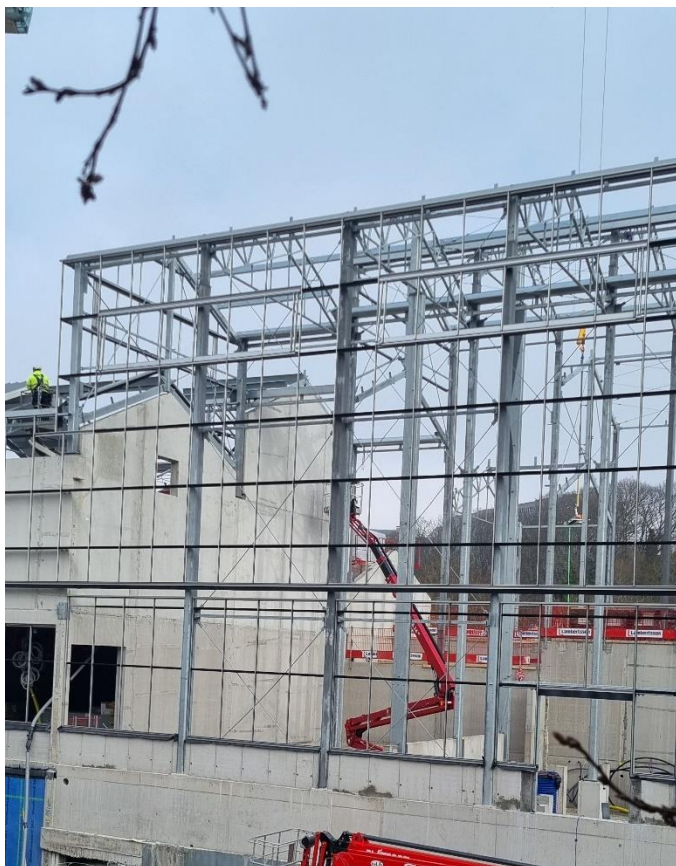
Bild 2. Växthusstomme med profiler förberedda för glasing