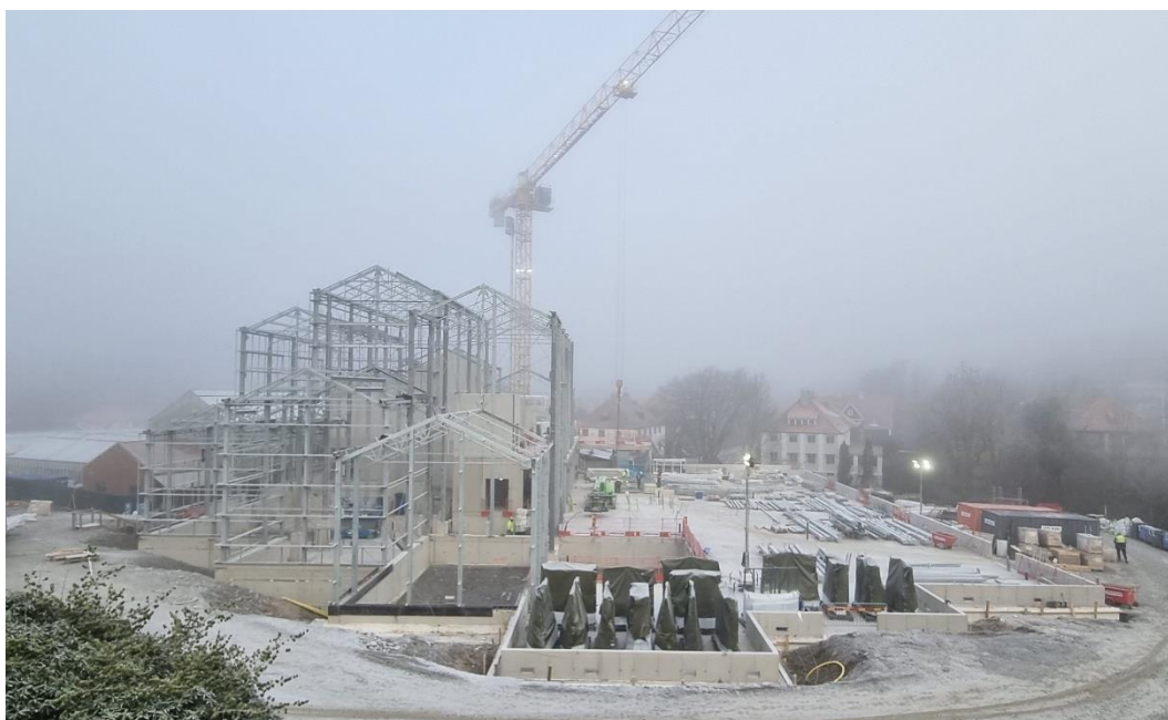
Bild 1. Översiktsbild arbetsområde etapp 2

Just nu arbetar växthusmontören med att montera tak på installationsytor samt aluminiumprofiler och glas i de tre skepp som är uppe. Kommande veckor påbörjas montage av stålstomme i nästa skepp.