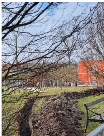
Bild 4 och 5. Pågående markarbeten på olika platser i huvudentréområdet