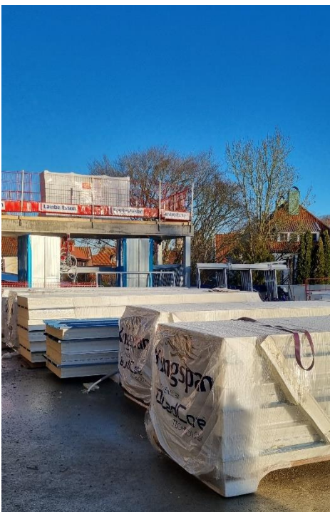
Bild 5. Sandwichpanel till tak ovan installationsutrymmen på plan 3 monterar kommande veckor.