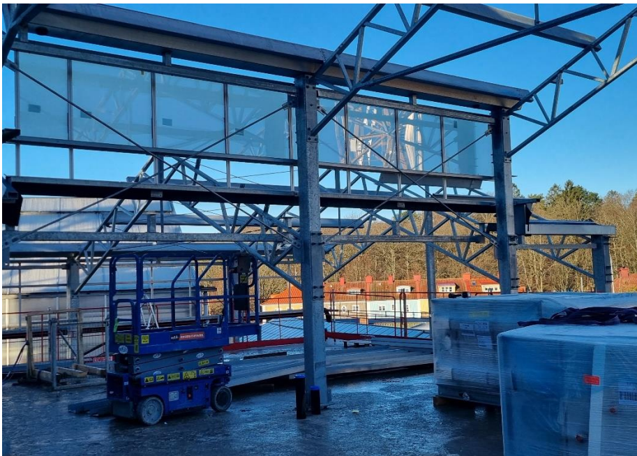
Bild 4. Första glaset på plats, fasad vid installationsutrymme plan 3.