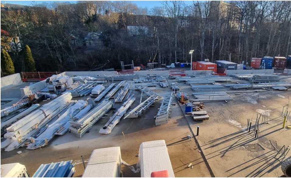
Bild 2. Delar till stålstomme växthus som väntar på montage