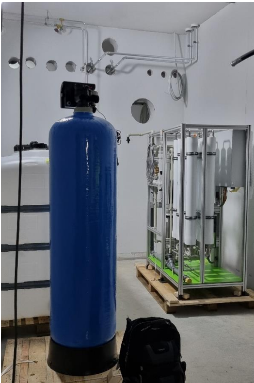
Bild 3. Pågående installation vattensystem