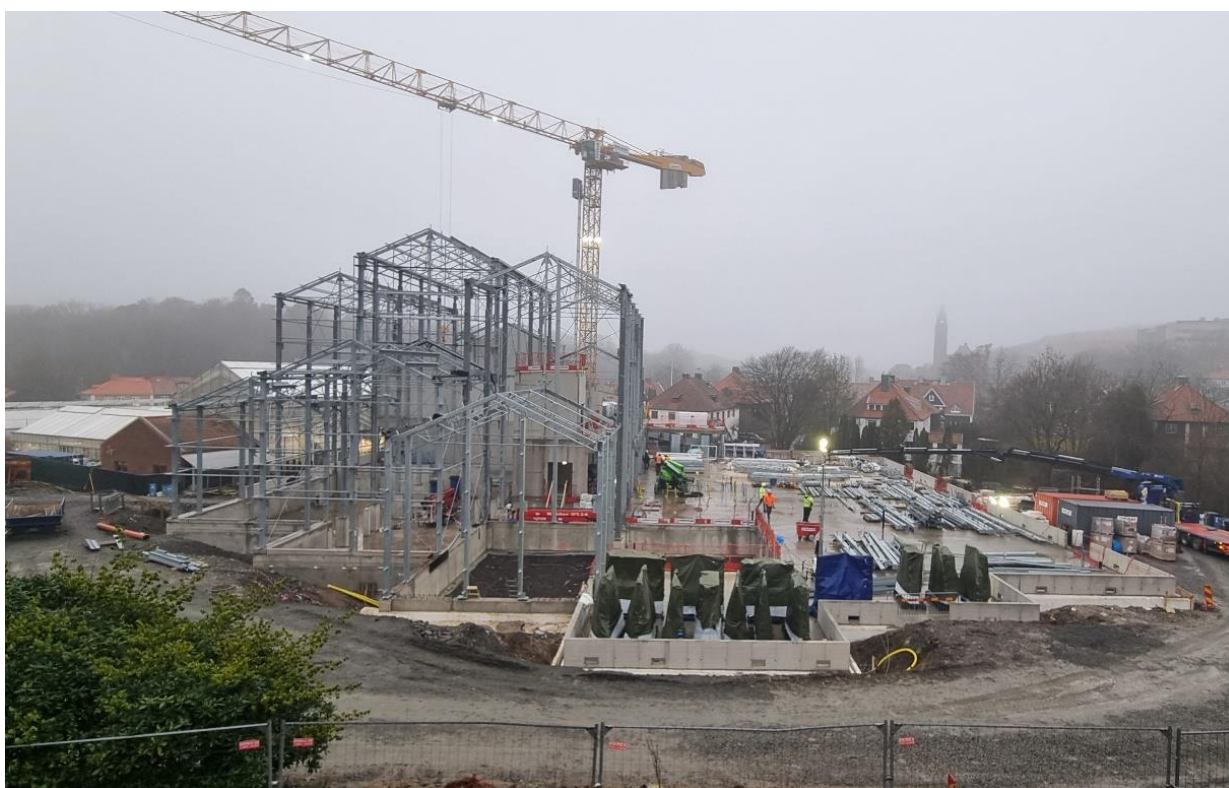
Bild 1. Översiktsbild arbetsområde etapp 2

Installationerna i källaren pågår för fullt, bland annat installeras vattenrening och reservkraft. Avslutande betongarbeten pågår i form av spackling och slipning för att få en fin yta på plan 2 och plan 3. Det sker även arbeten för att förbereda kommande montage av tegel på socklar.