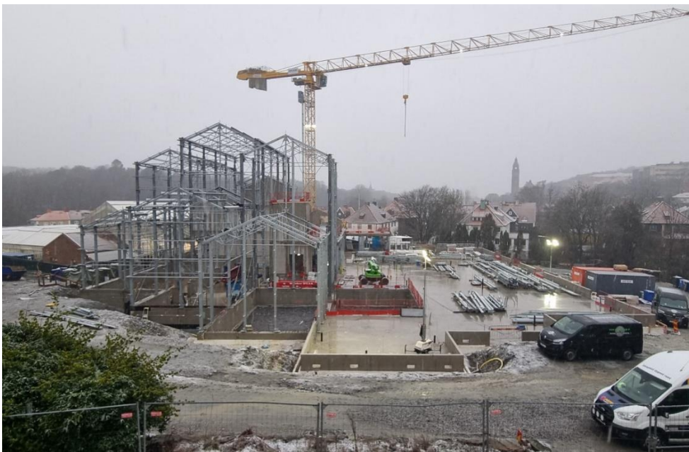
Bild 1. Översiktsbild arbetsområde etapp 2

Veckorna som kommer sker arbeten med montage av undertak, brandfogning, samt mer och nya installationer i källaren.