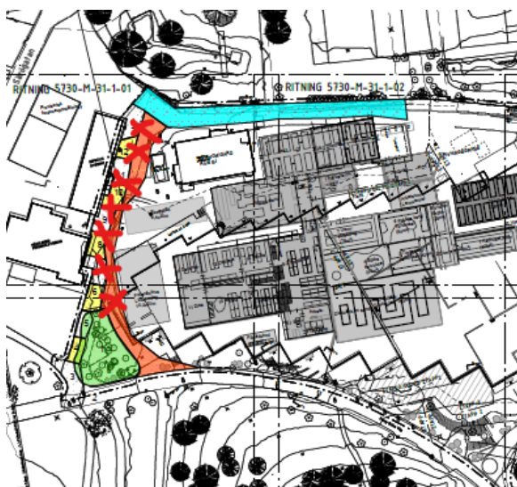
Bild 3. Område som berörs av arbete VA-schaktning.