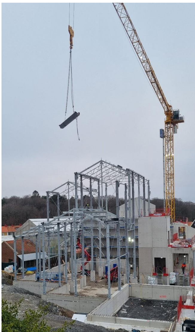
Bild 2. Pågående montering stålstomme