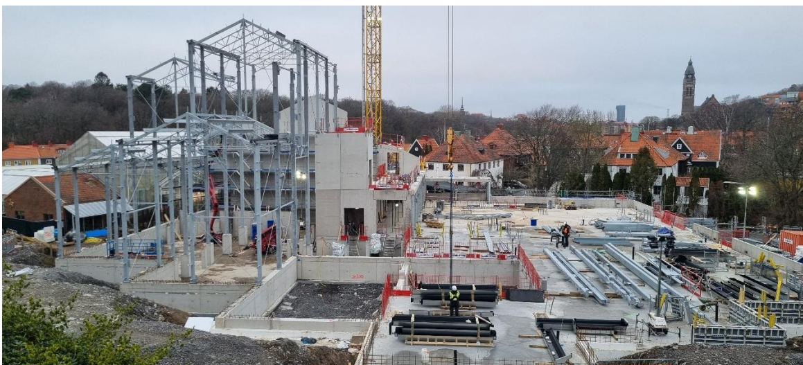
Bild 1. Översiktsbild arbetsområde etapp 2

Under de kommande veckorna kommer väggar och tak i källaren att målas. Det kommer också ske fortsatta arbeten med installationer i taket i källaren. Växthusmontören kommer efter mellandagarna att fortsätta sin framdrift med montage av stålkonstruktion.