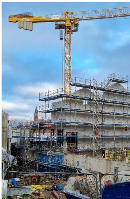
Bild 2. Arbetsställning på plats

Upphängning av installationer pågår för fullt i källaren där stråk för både vatten och ventilation skall dras.