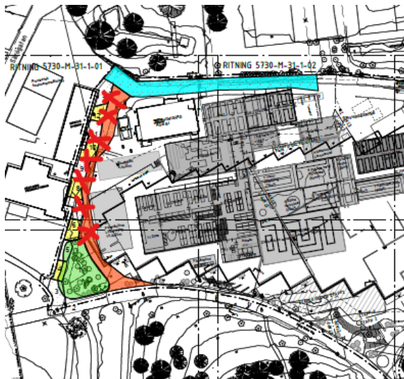
Bild 4. Område som berörs av arbete VA-schaktning.

Arbetet med VA-schaktning pågår och medför stor påverkan på framkomligheten på Fanny Grens väg. Vägen är avstängd dagtid kl 07.30-16.30 på måndag och tisdag samt torsdag och fredag från och med 18/11 till och med 23/12. Avstängningen av Fanny Grens väg medför också att samtliga transporter till och från arbetsområdet går via Malmgårdsgatan under hela perioden som arbetet pågår.