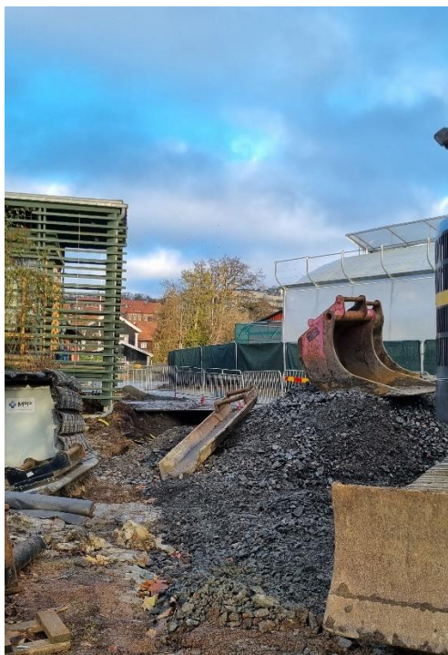
Bild 5. Pågående arbete VA-schaktning