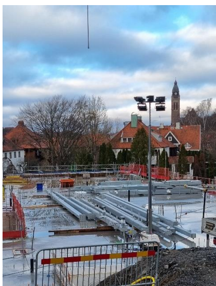
Bild 3. Stålstomme som snart skall börja monteras

Växthusstommen skall börja resas och detta medför stora och otympliga lyft som kräver säkerhetszoner mot befintlig verksamhet. (Hanteras i separat info till berörda).