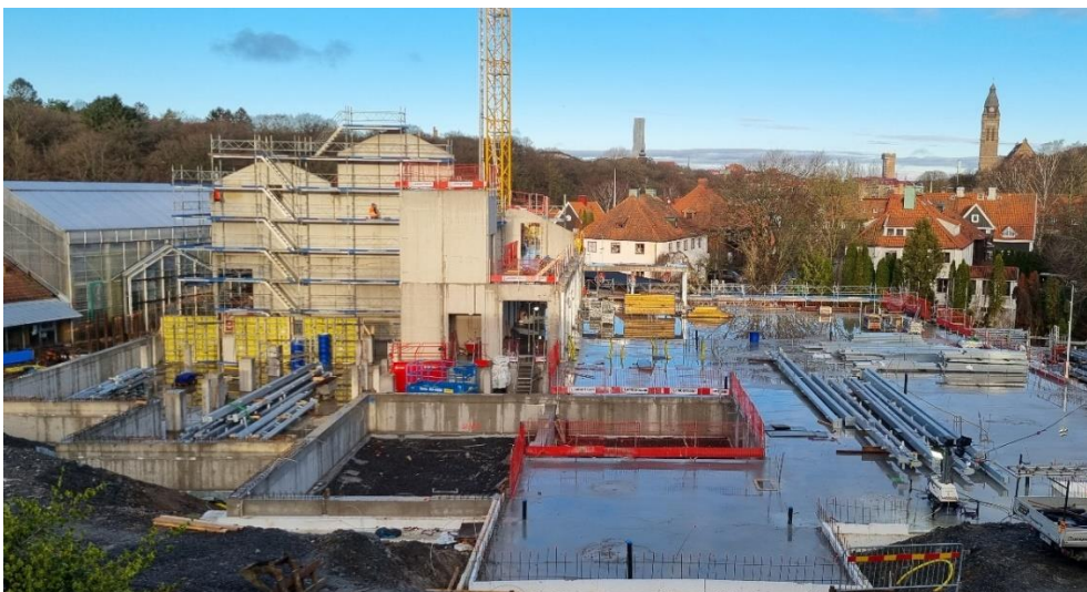
Bild 1. Översiktsbild arbetsområde etapp 2

De senaste veckorna har den sista bottenplattan gjutits och även de prefabricerade betongelementen är monterade och fyllda med betong. Bockryggar, stämp och väggstag är demonterade vilket skapar en mer rymlig känsla i byggnaden. Växthusmontören har påbörjat borring av infästning till stålstommen. Innerväggar på källarplan är uppresta och skivmaterial är monterat på ena sidan för att installatörer skall kunna dra installationerna i väggarna.