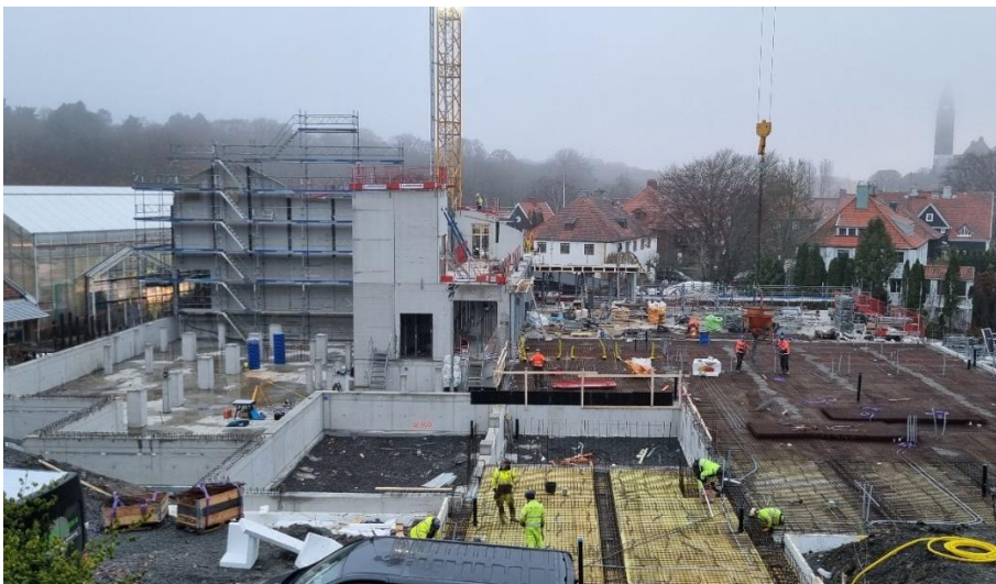
Figur 1. Översiktsbild arbetsområde etapp 2

Betongväggar för avdelning djungel/ruin är färdigställda och arbete med betongplintar för växthusstomme är också klara. Arbetet med att färdigställa betongstommen pågår för fullt. Ytterväggarna på plan 1 har precis avslutats och arbeten med innerväggarna är i gång. De kommande veckorna skall betongstommen slutföras och sista leveransen av prefab elementen kommer måndag 18/11. Växthusentreprenören är på plats för montage av stålstommen och detta kommer att innebära stora transporter på Malmgårdsgatan kommande veckor.