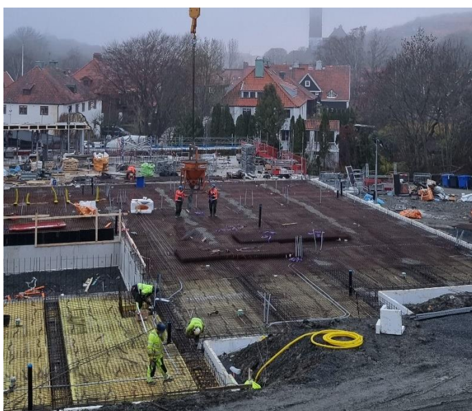
Figur 3. Påbörjad gjutning av bottenplatta.