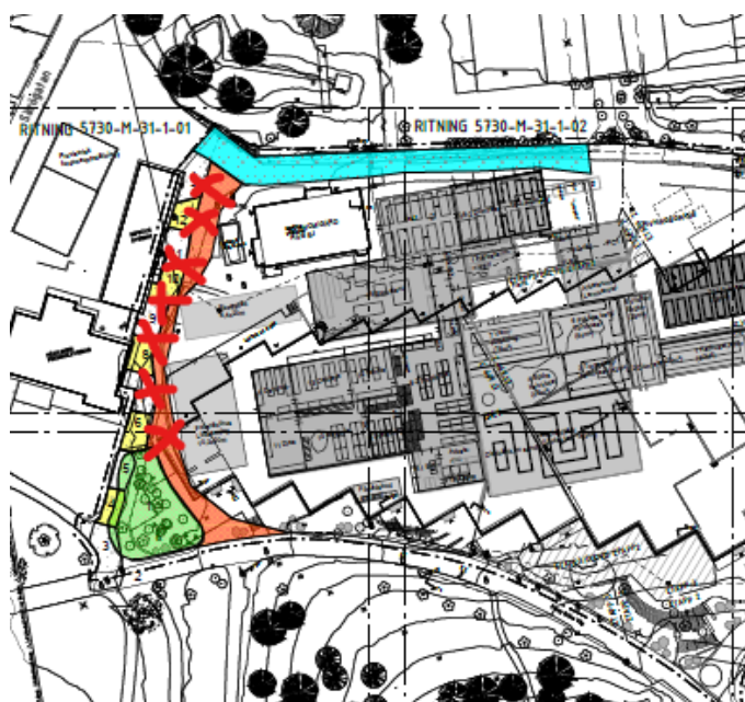
Figur 4. Område som berörs av arbete VA-schaktning. Under perioden 18/11 – 23/12 är vägen helt avstängd dagtid kl 07.30-16-30, mån-tis samt tor-fre.

Arbetet med VA-schaktning pågår och vattnet till de nya ledningarna är nu anslutet. Schaktet vid grönytan är igenfyllt för att säkerställa framkomligheten för besökarna ner mot entréområdet. Arbetet fortsätter nu framåt vilket kommer att ha stor påverkan på framkomligheten på Fanny Gréns väg. Vägen är avstängd dagtid kl 07.30-16.30 på måndag och tisdag samt torsdag och fredag från och med 18/11 till och med 23/12. Avstängningen av Fanny Gréns väg medför också att samtliga transporter till och från arbetsområdet går via Malmgårdsgatan under hela perioden som arbetet pågår.