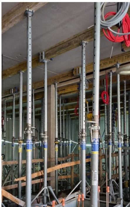
Figur 4. Bock och stämp som skall tas ner och flyttas upp en våning för montage av nästa plattbärlag.

Bock och stämp kommer placeras ut på plan 2 inför montage av nästa bjälklag som beräknas ske torsdag och fredag vecka 41. Fortsatt arbete med formning och armering av bottenplattan i djungel/ ruin.