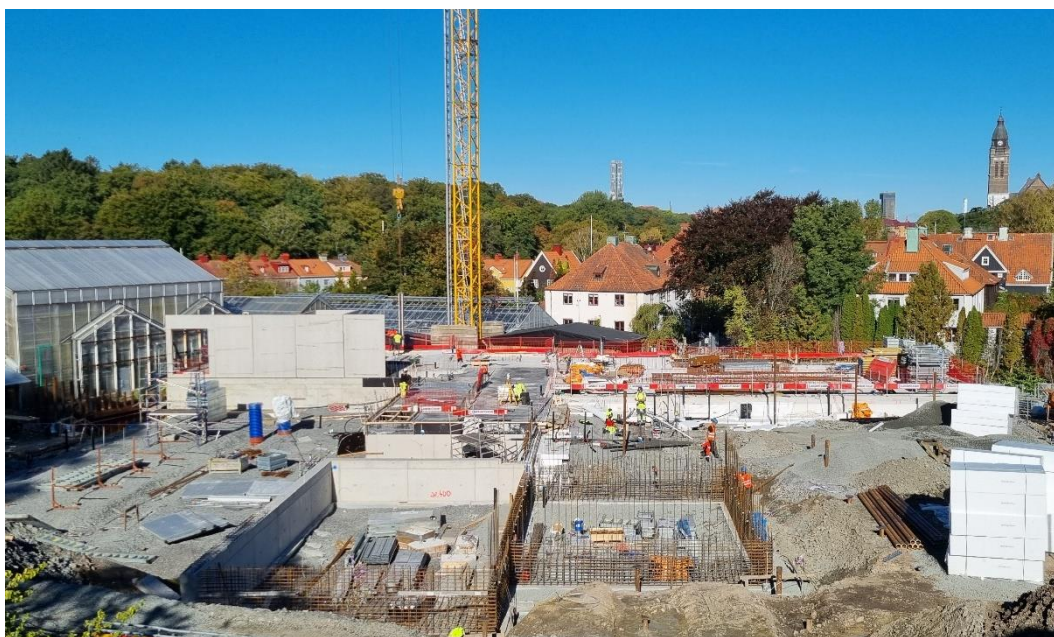
Figur 1. Översiktsbild arbetsområde etapp 2

Stag i källaren skall rivas och flyttas upp en våning för nästa montage av prefabelement som sker 3-4 oktober. Montaget av prefabelement kräver säkerhetszon i befintliga växthus. Separat information med mer detaljer skickas till berörd verksamhet.