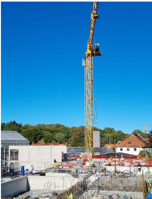
Figur 3. Prefab-element lyfts på plats