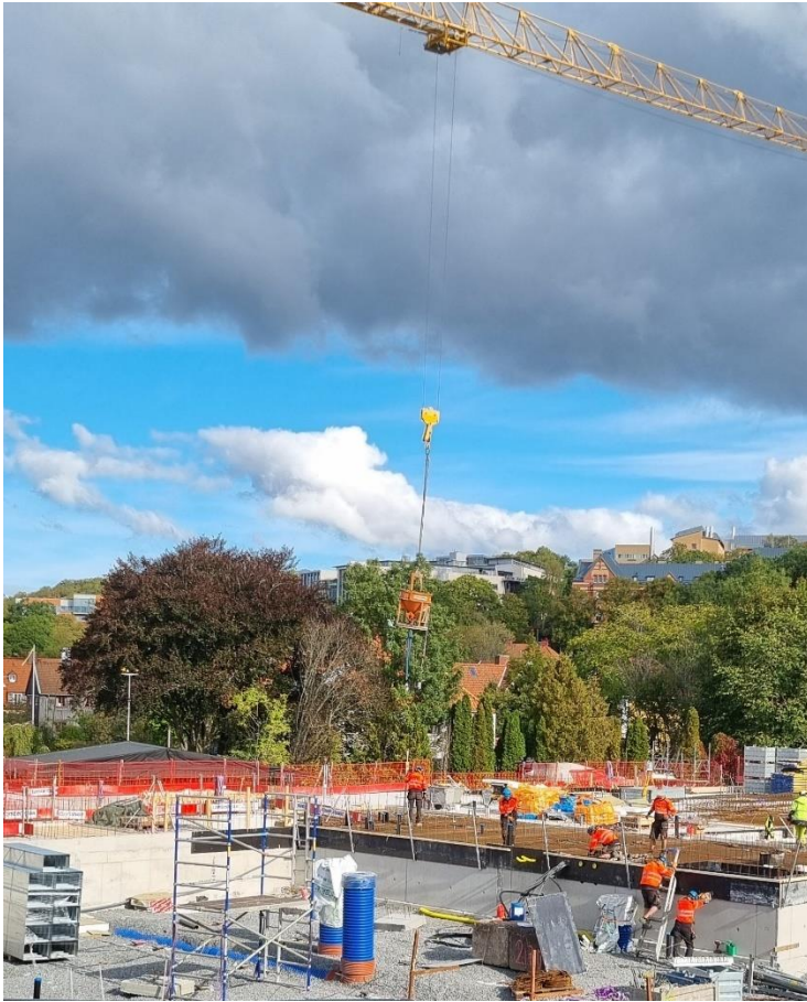
Figur 2. Gjutning bjälklag pågå