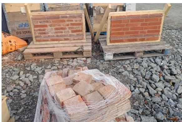
Figur 3. Mockup fasadtegel

Utöver produktionsarbetet så pågår parallellt arbete med att färdigställa detaljprojektering och säkerställa materialval. Bland annat har man tagit fram mock-ups på olika tegelblandningar som skall klä delar av fasaden och socklar.