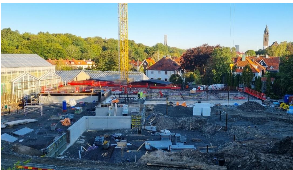
Figur 1. Översiktsbild arbetsområde etapp 2

De två största momenten som avslutas i veckan, alternativt i början på nästa vecka, är gjutning av plattbärlag till våning 2 samt den sista pålningen av grunden till lökhus och alpin. Därefter sker uppehåll i pålningsarbetet fram till årsskiftet.