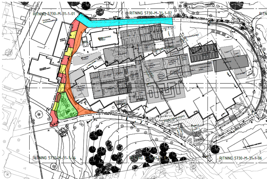
Figur 4. Område som berörs av arbete VA-schaktning och därmed påverkar framkomlighet för fordon på Fanny Gréns väg.

Mellan 1 oktober till och med 20 december kommer det vara begränsad framkomlighet för fordon på Fanny Gréns väg, periodvis kommer det vara helt avstängt. Anledningen är ett arbete med schaktning för VA kopplat till projektet. Arbetet inleds med att grönytan avverkas i början av oktober, se markering nedan. Arbetet hanteras etappvis och kommer ske i tät dialog mellan berörda parter.