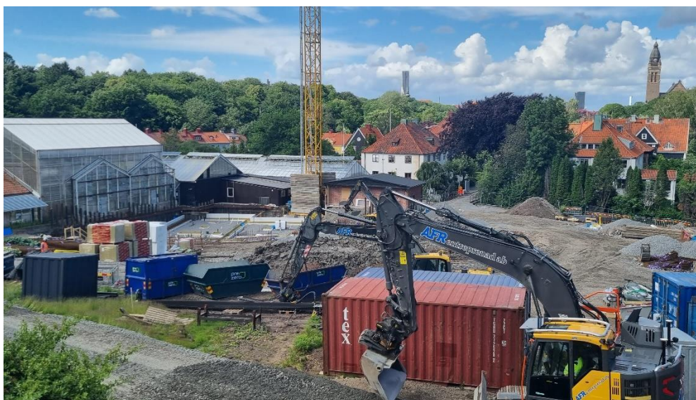
Figur 1. Översiktsbild arbetsområde etapp 2

Grundläggningsarbeten pågår med aktiviteter såsom schaktning, pålning och makadamisering.