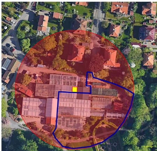
Figur 2: Röd cirkel symboliserar kranarmens rörelseomfång och blå linje den zon inom arbetsområdet där hängande last är tillåten.

Lyft kommer endast att göras över byggområdet. I den delen av kranarmen som befinner sig utanför byggstaket dvs rör sig över befintliga fastigheter och gator kommer det aldrig att hänga någon last.