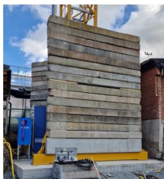
Utsida kranfot, 100 ton motvikt, 50 på vardera sida om masten.