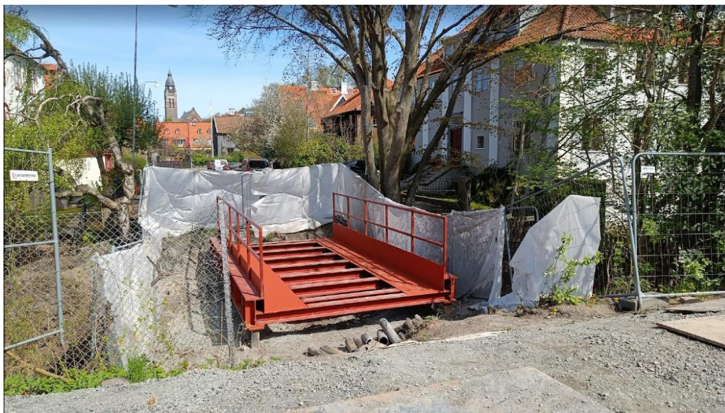
Figur 3: Tillfällig bro från Malmgårdsgatan in mot arbetsområdet

Anläggande av tillfällig bro pågår och bron beräknas stå klar och tas i bruk under vecka 20.