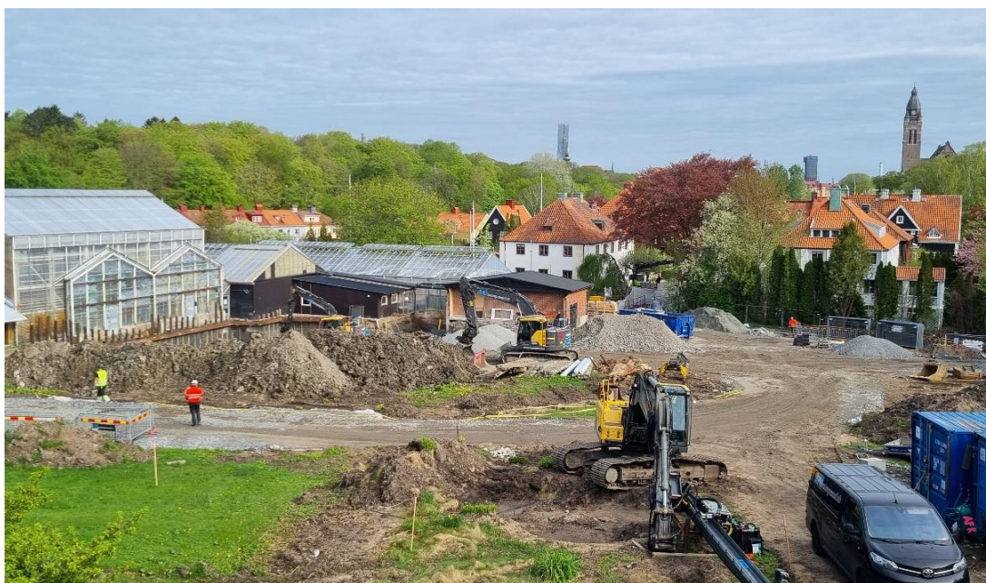
Figur 1. Översiktsbild arbetsområde etapp 2

Schakt- och markarbeten pågår inom arbetsområdet för etapp 2 området. Detta genererar ökad mängd transporter till- och från arbetsområdet. Pålning för kranfundament är nu slutfört och arbete med gjutning av kranfundament är påbörjat.