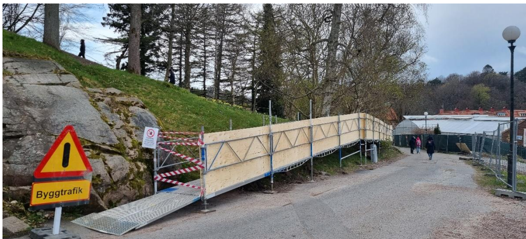
Figur 4: Pågående byggnation av spång