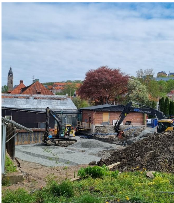
Figur 2: Markarbete pågår