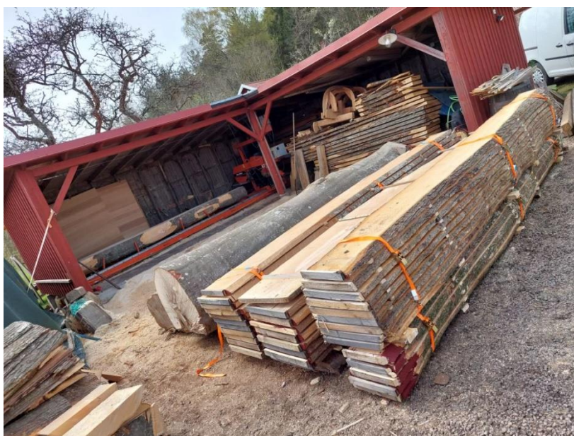
Figur 5: Uppsågade träd för återbruk

I samband med markarbeten så avverkades träd inom arbetsområdet. Dessa träd planeras användas i någon form av återbruk i projektet och ligger nu uppsågade och torkar på sågverket.