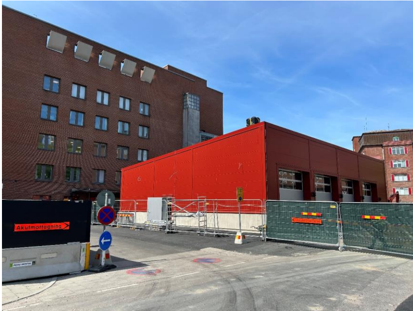
Provisorisk ambulanshall byggs vid Gröna stråket.

Arbetet med den provisoriska ambulanshallen, som byggs intill akutmottagningens entré, fortlöper. Passage förbi arbetsplatsen mellan Blå och Gröna stråket är avstängd för gång- och fordonstrafik, se Trafikomläggning . Provisorisk ambulanshall är planerad att tas i bruk oktober.