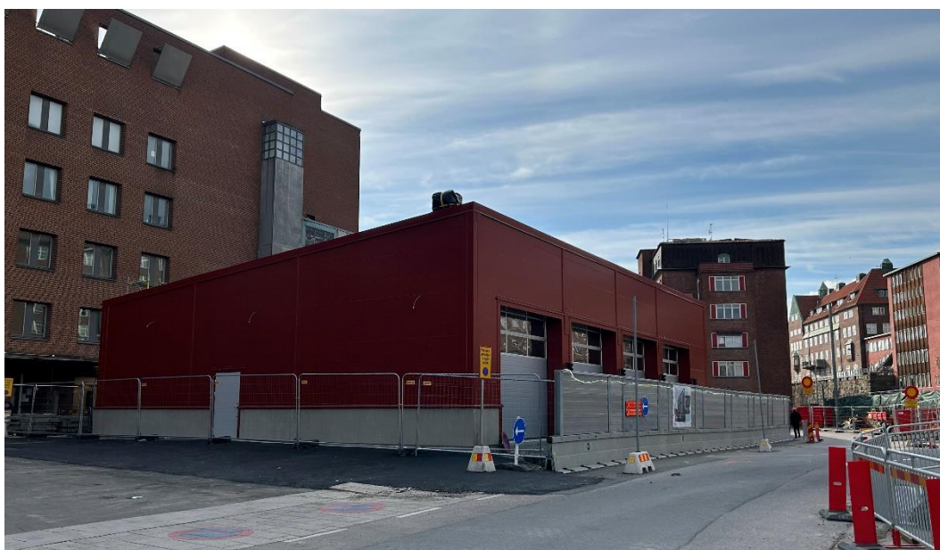
Provisorisk ambulanshall byggs vid Gröna stråket (I)

En provisorisk ambulanshall byggs framför akutmottagningens entré, vid infarten till den befintliga ambulanshallen. Genomfart vid arbetsplatsen är avstängd för persontrafik och är enbart möjlig för gångtrafik, ambulansfordon, transporter och byggtrafik. Från och med 6 maj stängs vägen av för all gång- och fordonstrafik, se rubrik Förberedelse inför trafikomläggning ovan.