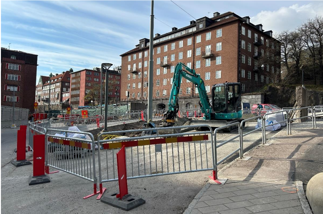
Ny infart Per Dubbsgatan (A)

Arbete med att bygga en ny infart på ytan vid tidigare utfart pågåår. Framkomligheten på Blå stråket påverkas. Den nya infarten planeras att öppnas i maj.