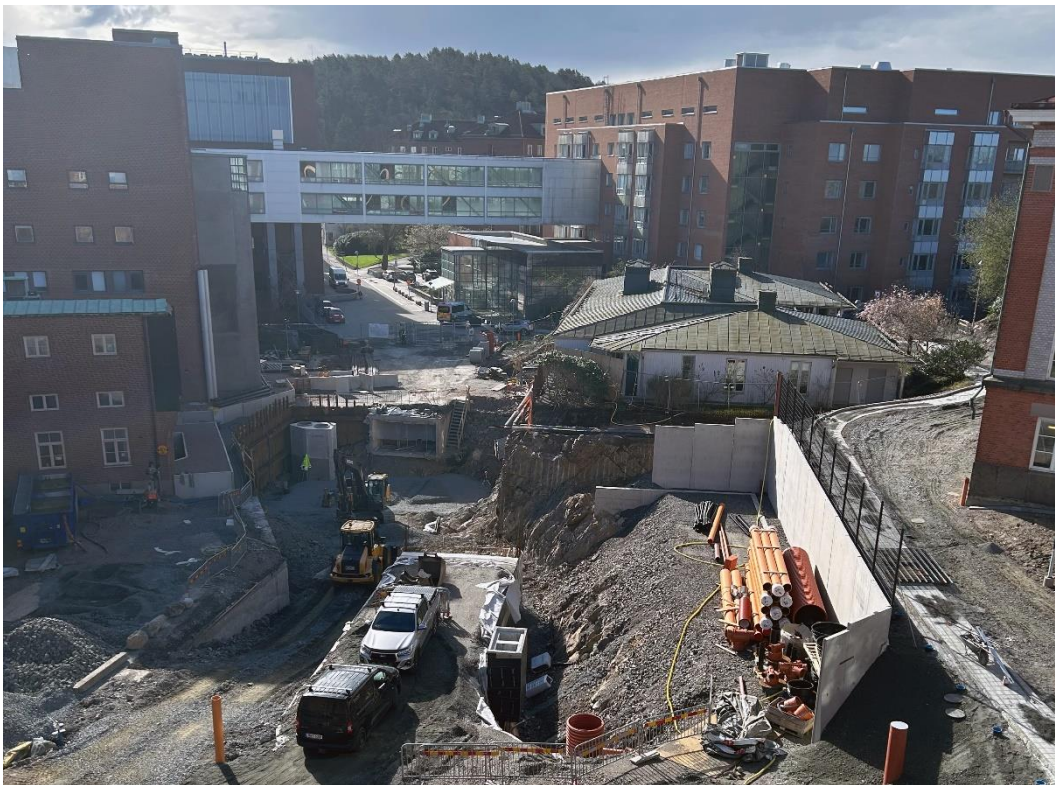
Byggnationen av kulverten mellan Gröna och Bruna stråket pågår.

Återställningsarbeten kommer att utföras vid korsningen Bruna/Röda stråket.