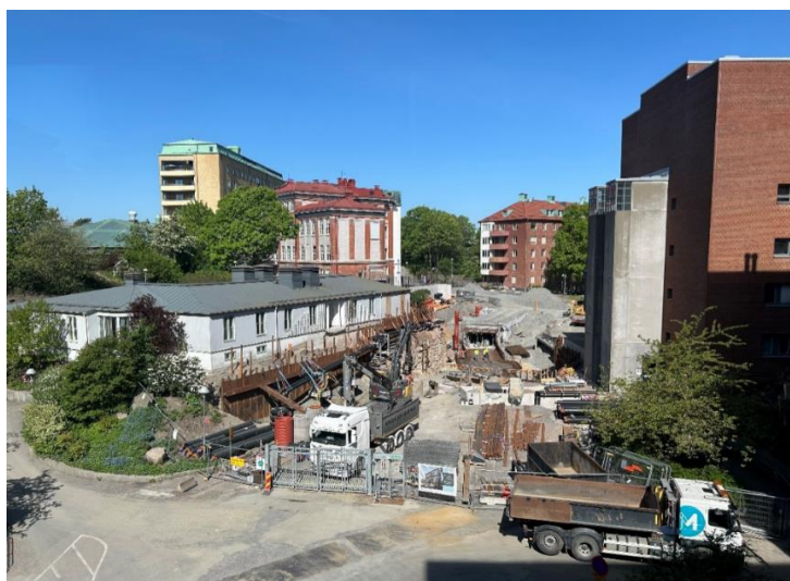
Kulvertarbeten vid korsningen mellan Bruna och Röda stråket