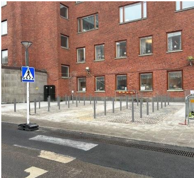
Nya cykelparkeringsplatser på Blå stråket 3.

Nu finns det 65 nya cykelparkeringsplatser på Blå stråket 3.