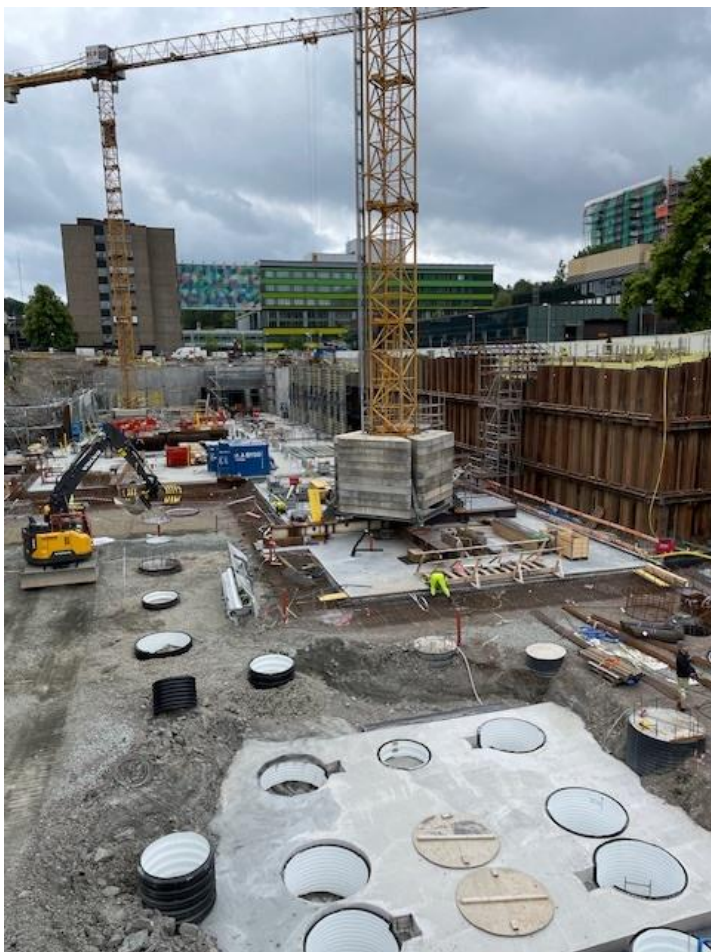
Bild 1 Sista delen i norr, där grundläggningsarbeten pågår.