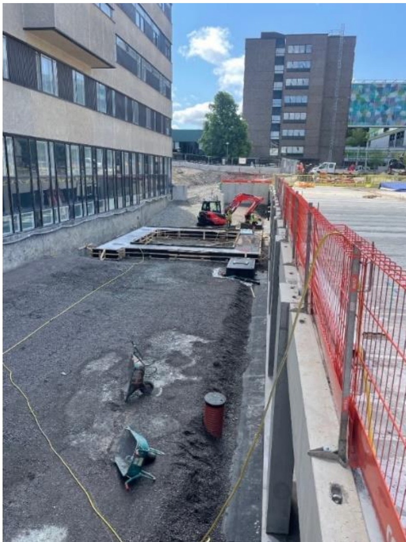
Bild 2 Kranfundament

Bygget är planerat att vara stängt under veckorna 28-31.