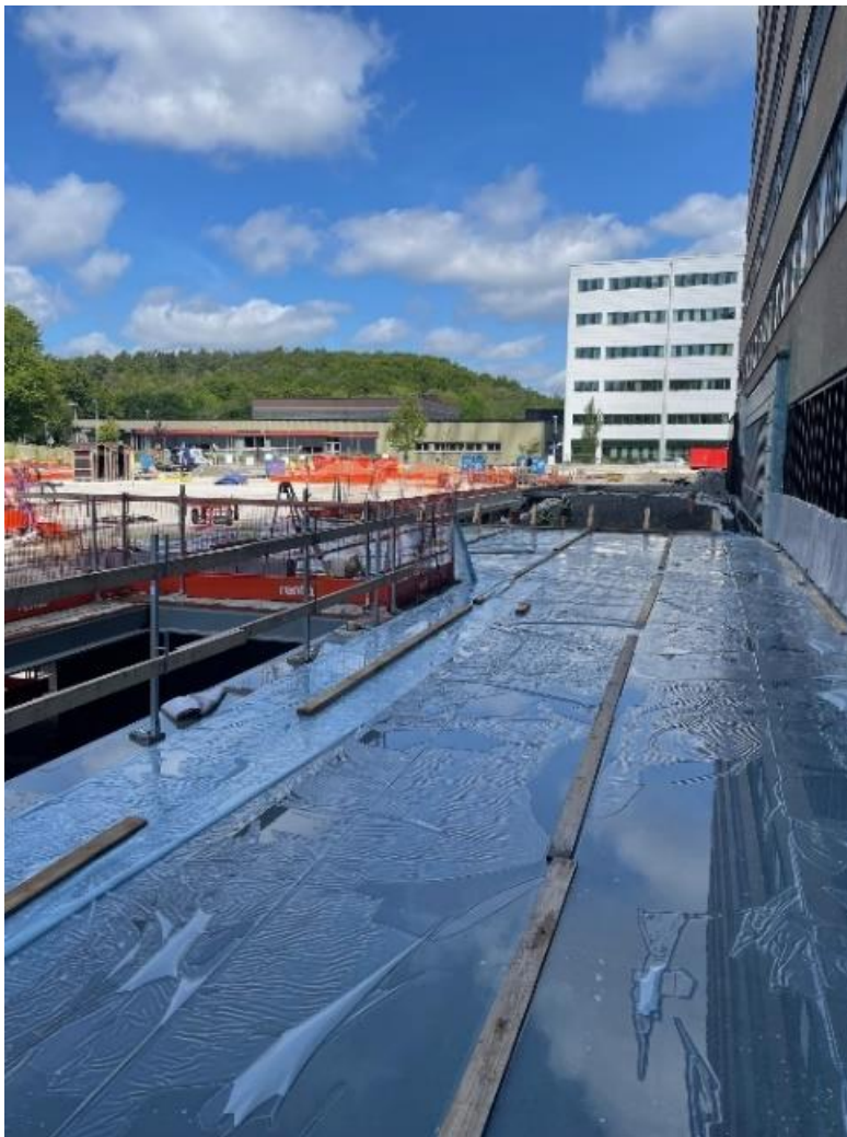
Bild 1 Nygjuten bottenplatta