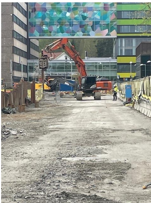
Bild 1 Spontdragning

Övrigt: Glaspartier fortsätter att monteras i Kvinnoklinikens fasad och omkringliggande fasad- och plåtarbeten kommer utföras. Dessa arbeten kommer till viss del uppfattas som störande.