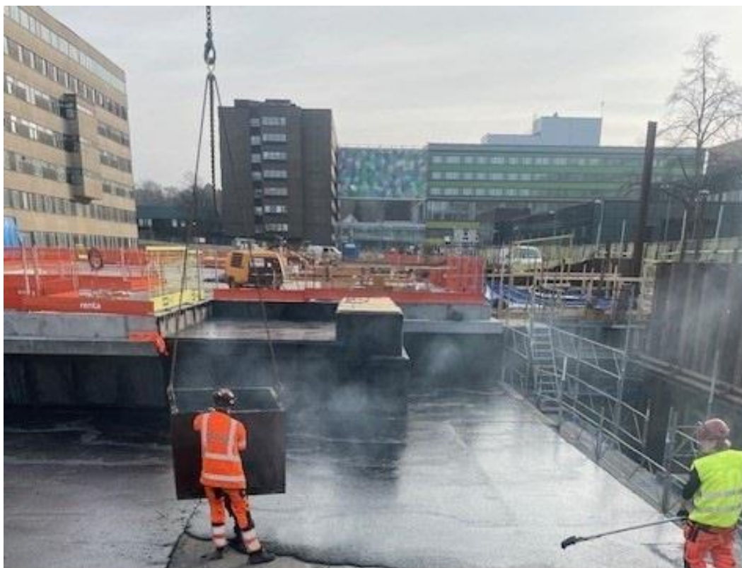
Bild 1 Läggnig av tätskikt på kulvert