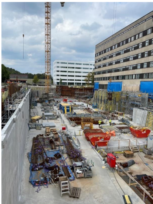
Bild 1 Översiktsbild från söder