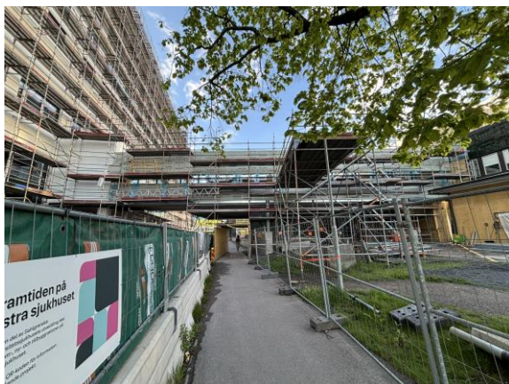
Förbindelsegången mot CK