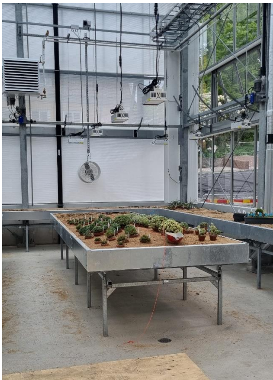
Figur 4. Växter som fått nytt hem i sandfyllda växtodlingsbord