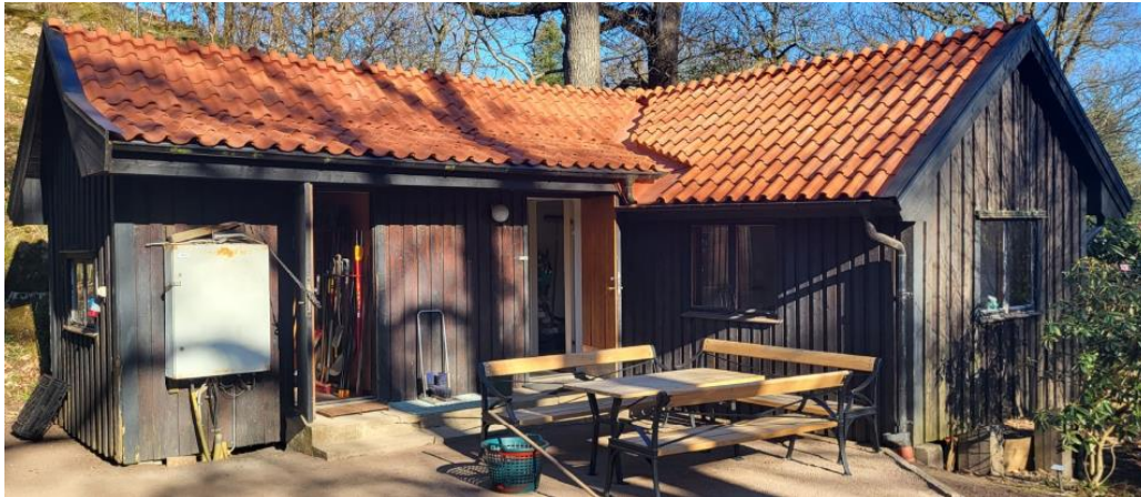
Figur 7. Alpstugan som ska renoveras