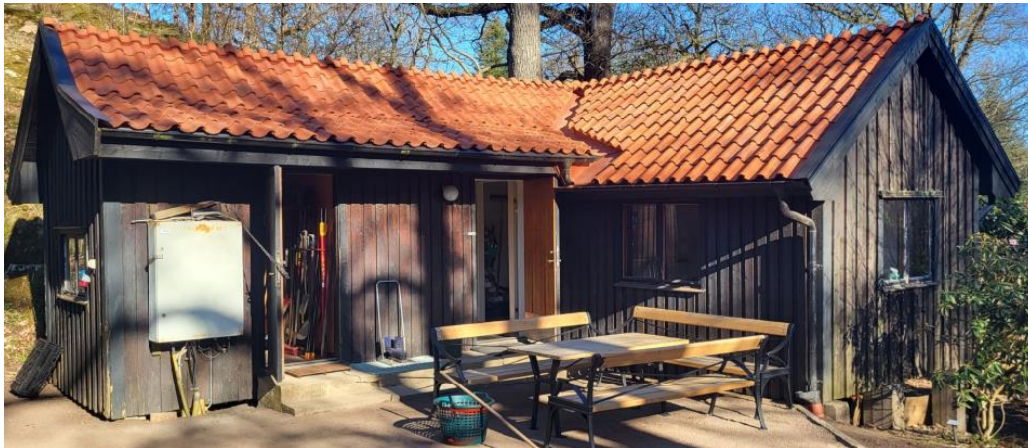
Figur 7. Alpstugan som ska renoveras