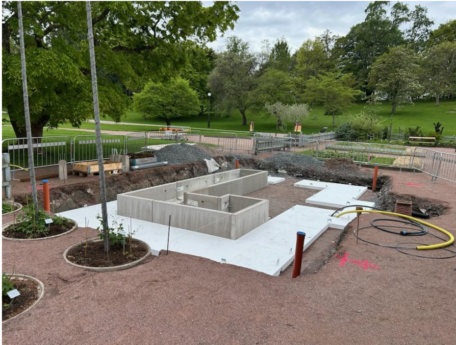
Figur 5. Grundläggning av det nya visningsväxthuset pågår