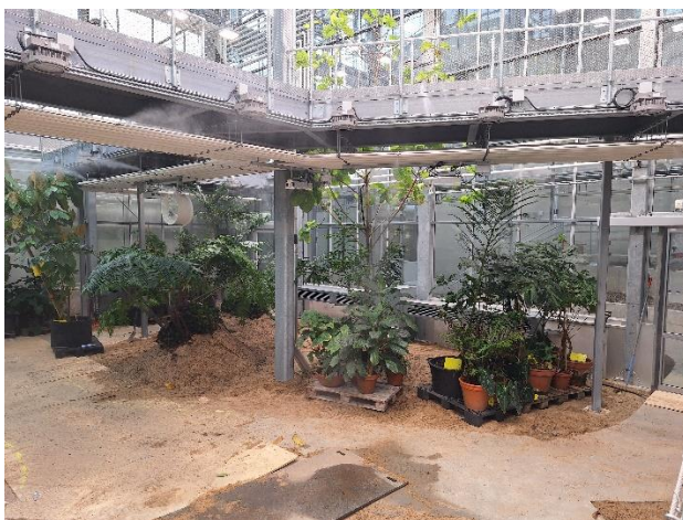
Figur 2. Pågående växtflytt i avdelning djungel och ruin

SVT gjorde nyligen ett inslag om växtflytten, se inslaget här: Botaniskas största satsning – flyttar 10 000 växter | SVT Nyheter