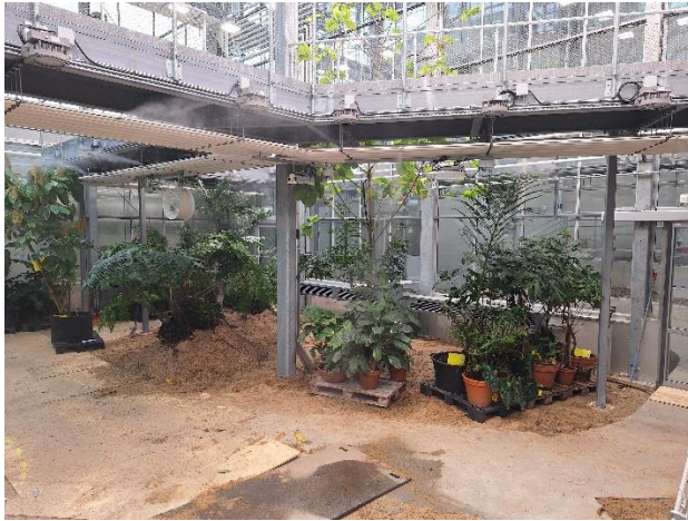
Figur 2. Pågående växtflytt i avdelning djungel och ruin