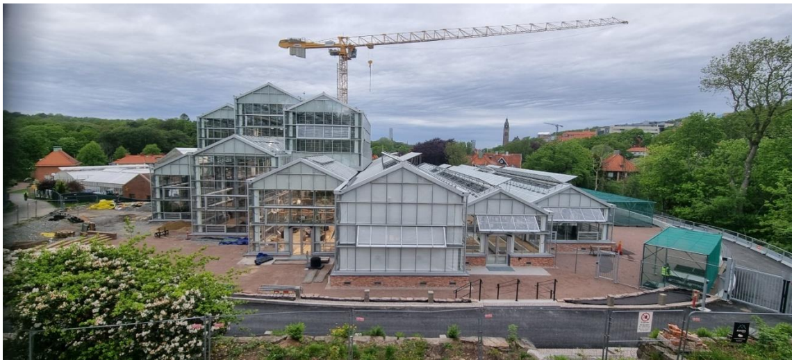
Figur 1. Vy mot söder