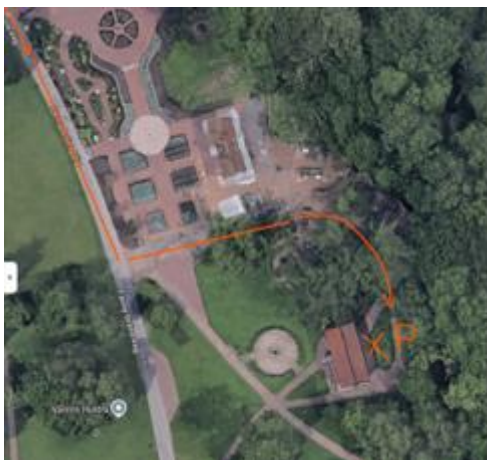
Figur 6. Bilden visar trafikflöde och P-plats för arbetsfordon