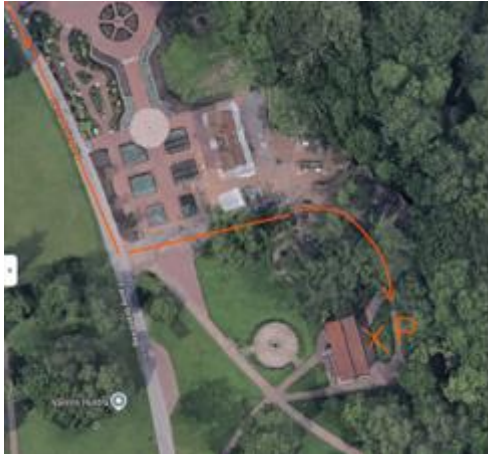
Figur 6. Bilden visar trafikflöde och P-plats för arbetsfordon