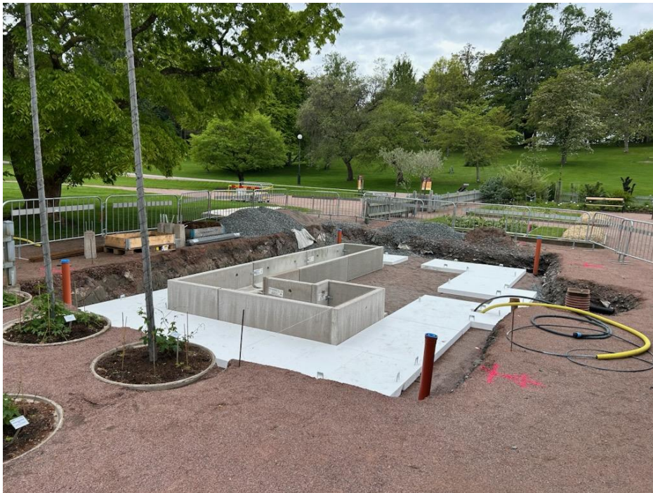
Figur 5. Grundläggning av det nya visningsväxthuset pågår

Kontaktperson: Charlotta Karlsson, Projektledare Västfastigheter charlotta.bogya.karlsson@vgregion.se