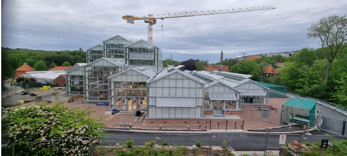
Figur 1. Vy mot söder