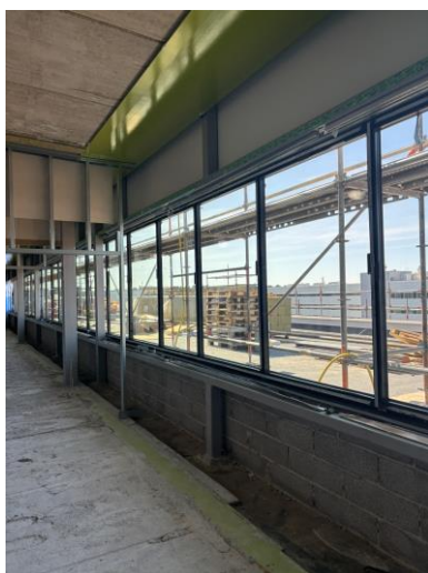
Från våningsplan 8