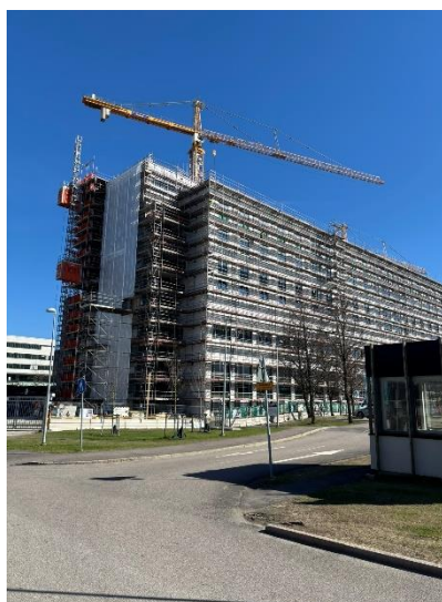
Utvändig bild från norra sidan om FoN