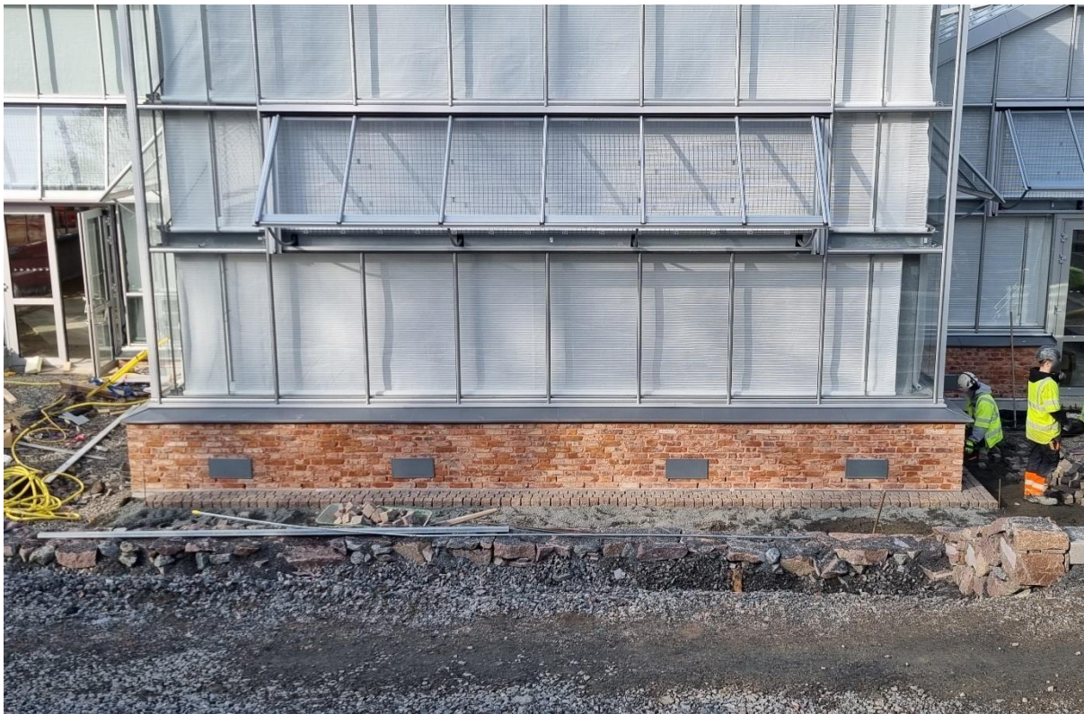
Figur 4. Pågående arbete med att lägga smågatsten runt byggnaden

Utvändiga arbeten har återupptagits och man arbetar bland annat med grusning och stenläggning runt byggnaden. Mindre kompletteringar kvarstår även på fasad och kring utvändiga byggnadsarbeten.