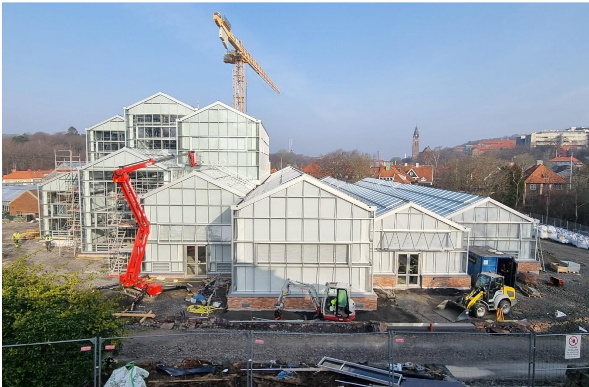
Figur 1. Vy mot söder