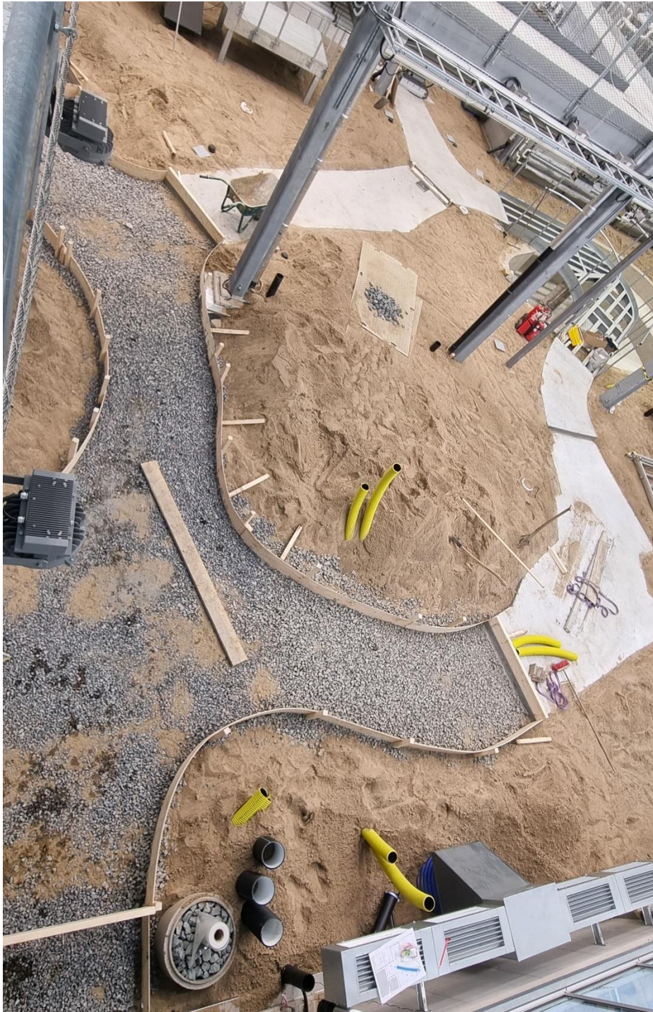
Figur 2. Förberett för gjutning av betonggångar i avd djungel & ruin

med påfyllning av odlingssubstrat i växbäddar. I samma avdelning pågår också uppbyggnad av betongtrappa mellan plan 2 och plan 3.