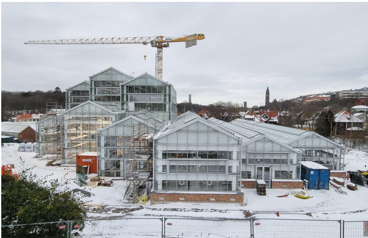
Figur 1. Vy mot söder