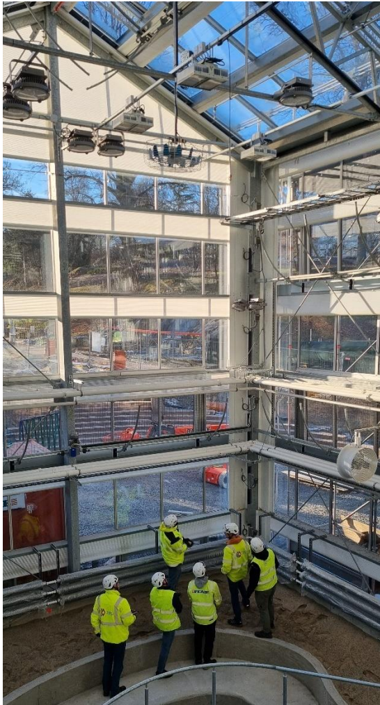
Figur 7. Pågående förbesiktning

Förbesiktningar har påbörjats och därefter är det endast mindre arbeten som uppstår/kvarstår.