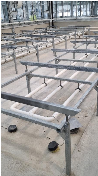
Figur 6. Värmerör under växtodlingsbord