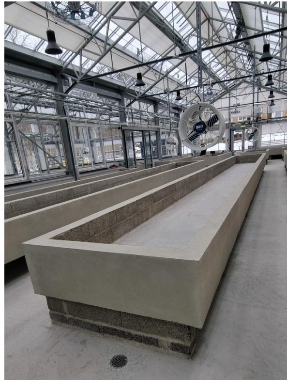
Figur 5. Färdiga LECA-blocksbord