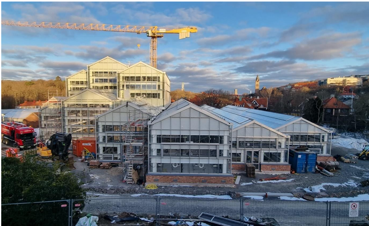
Figur 1. Vy mot söder