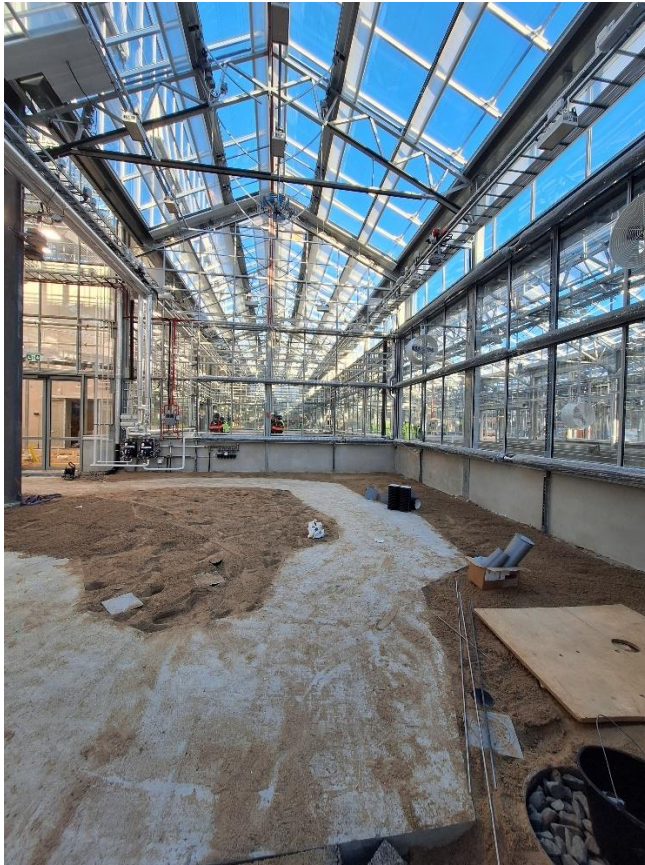
Figur 3. Odlingssubstrat i växtbäddar i avdelning öken & brand påfyllt.