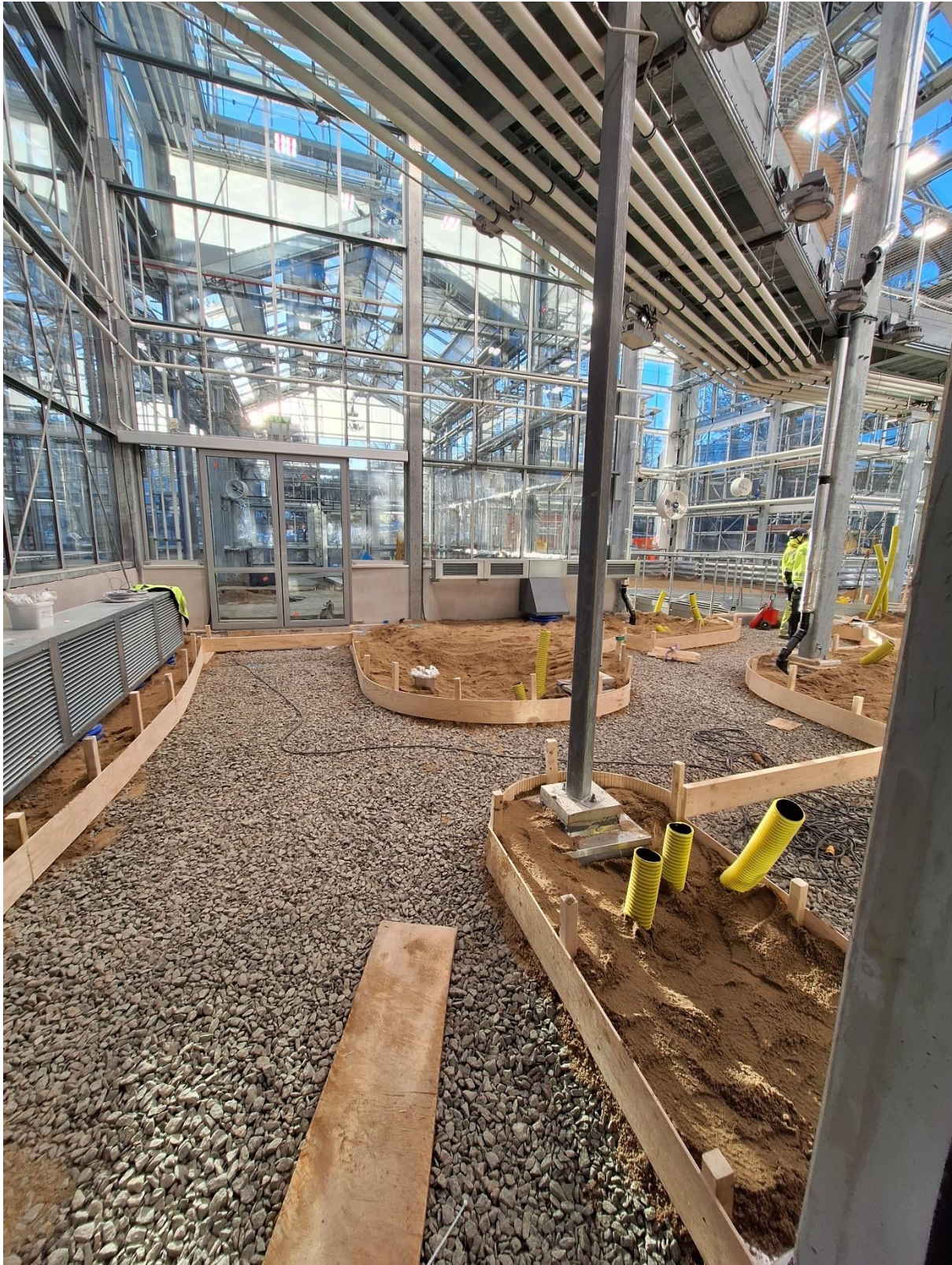
Figur 5. Förberett för gjutning av betonggångar i avd djungel & ruin

I övriga avdelningar färdigställer man sina arbeten och provar av och säkerställer funktioner på diverse installationer. Montering av växtodlingsbord pågår kommande veckor.