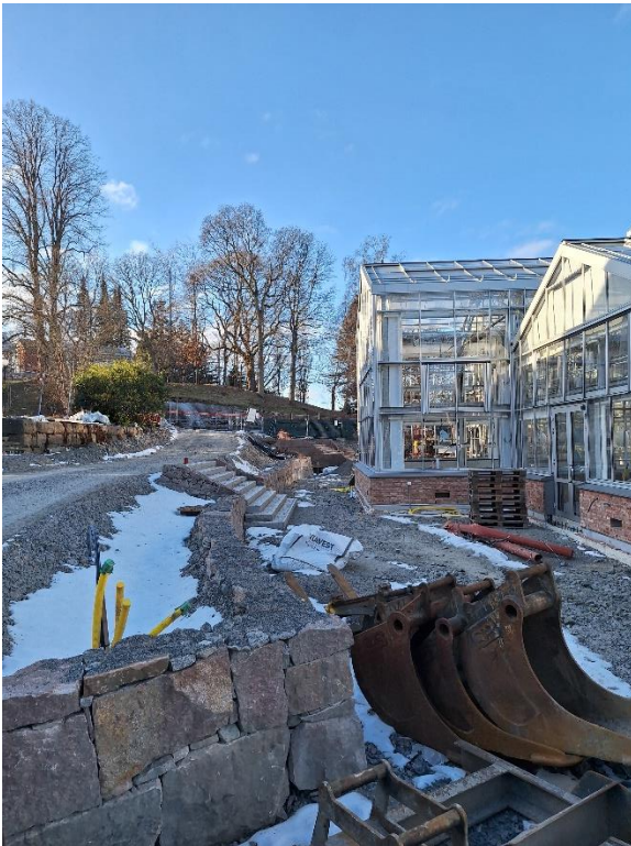
Figur 8. Utvändigt etapp 2

Utvändigt kvarstår arbete med markytor och ytskikt såsom asfalt, kantstenar och stenbeläggningar. Dessa arbeten återupptas i takt med att frosten och snön försvinner. Mindre kompletteringar kvarstår även på fasad och kring utvändiga byggnadsarbeten.