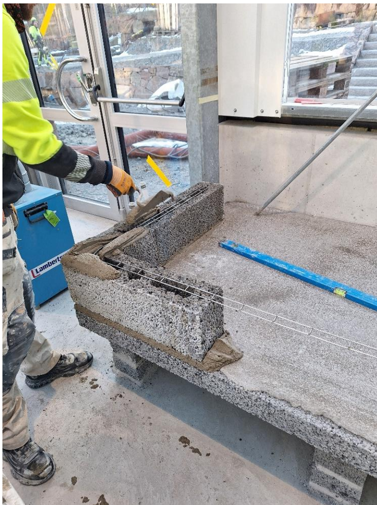
Figur 6. Arbete med montage LECA-blocksbord