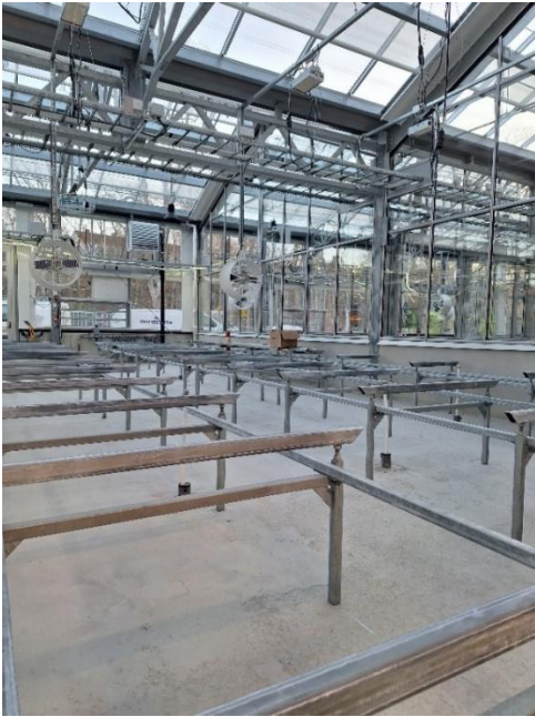
Figur 7. Pågående montage av växtodlingsbord

Förbesiktningar har påbörjats och därefter är det endast mindre arbeten som uppstår/kvarstår.