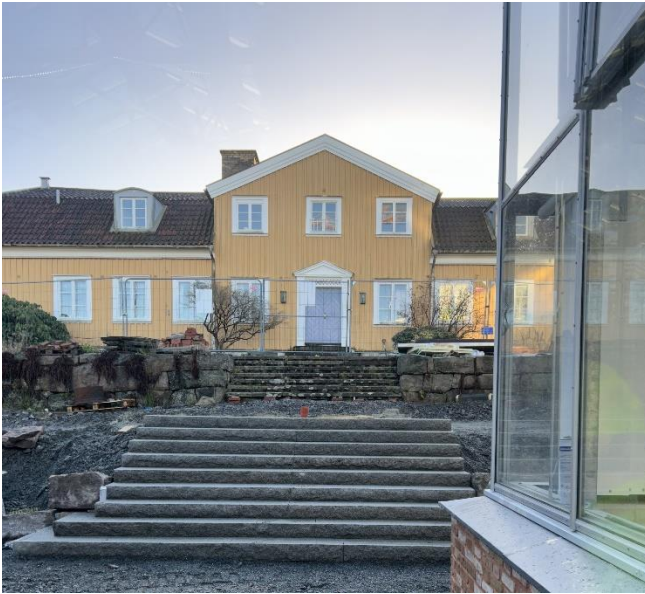
Figur 7. Granittrappa