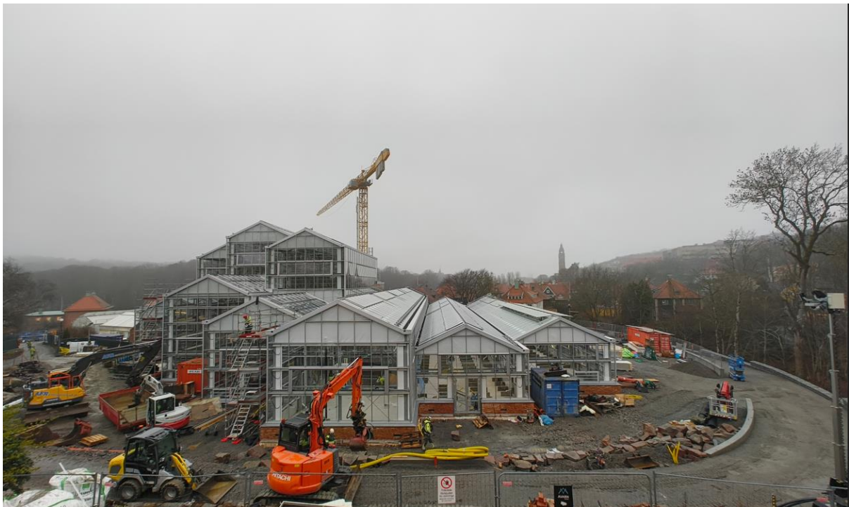
Figur 1. Vy från söder

Arbete med växtbäddar pågår fortsatt i flera avdelningar med olika moment såsom geomembran, montage av pordrän, grus- och sandpåfyllning. Materialet läggs i olika lager för att skapa rätt förutsättningar för växterna att kunna etablera sig och frodas. I avdelning öken & brand förbereds det för gjutning av betonggång och i avdelning djungel och ruin pågår gjutning av damm. Så snart gjutningen är klar kan smidesbron över dammen kan läggas på plats.