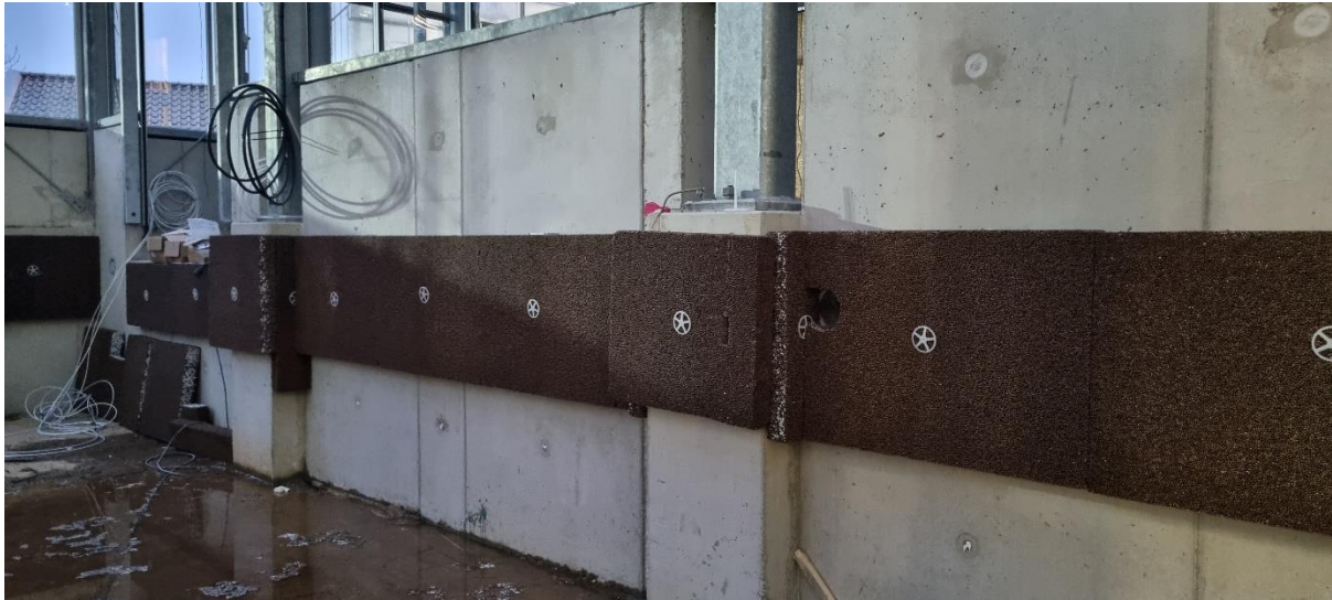
Figur 4. Pordrän i avdelning djungel & ruin

I övriga avdelningar i växthuset håller man på med de sista installationerna och montage av både växtodlingsbord och lecablocksbord. Kontorsdelar och installationsutrymmen är snart färdigställda och inom kort sker första slutstädet.