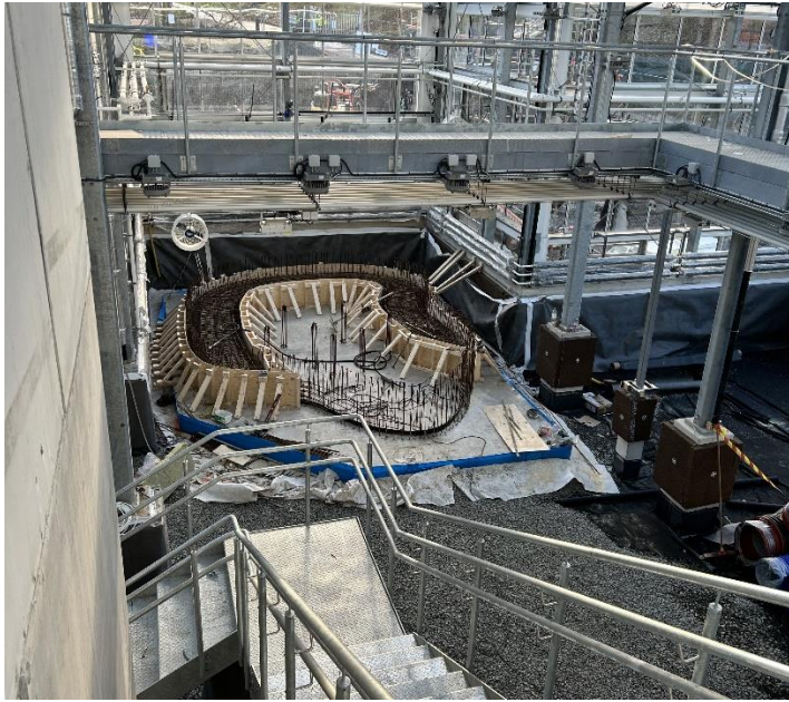
Figur 2. Gjutning av damm i djungel & ruin