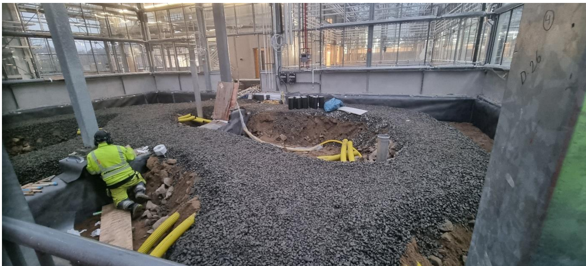
Figur 3. Uppbyggnad gångar i öken & brand