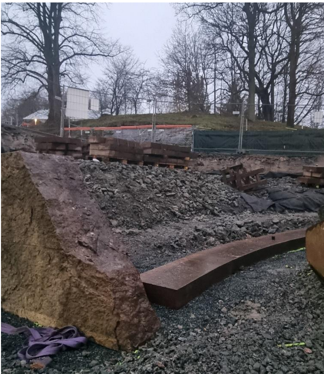
Figur 8. Uppbyggnad av amfitrappan påbörjad

Snart påbörjas dragnig av kablage till växthuset på Åsen. Detta arbete kan komma att störa åtkomsten uppe vid Åsen. Det skall även ske arbete med kabeldragnig utanför Stora Änggården som kommer påverka åtkomsten där. Mer info delges berörda så snart planering är klar.