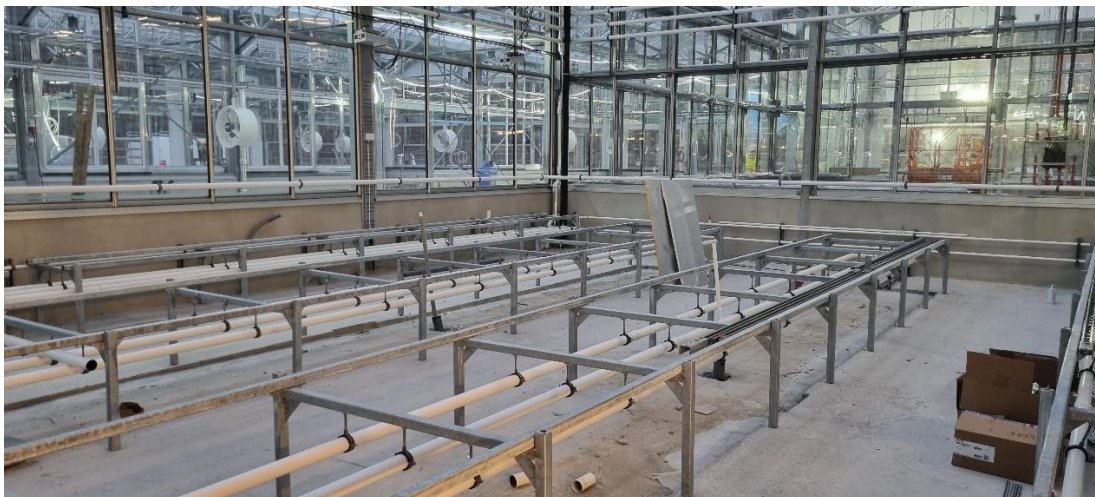
Figur 5. Pågående montage av växtodlingsbord

I övriga avdelningar i växthuset håller man på med de sista installationerna och montage av både växtodlingsbord och lecablocksbord. Kontorsdelar och installationsutrymmen är snart färdigställda och inom kort sker första slutstädet.