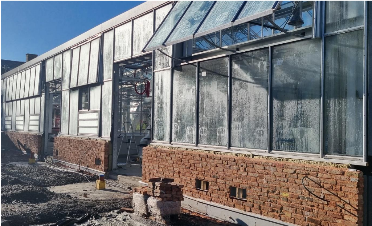
Figur 2 Fasad mot öster

Det pågår nu arbeten i de flesta avdelningar i växthuset. I vissa avdelningar är det full fart på montage av olika installationer medan det i andra avdelningar endast kvarstår kompletteringar. De flesta innerdörrar är på plats och man går nu vidare med montering av lås och beslag. Avprovningar av installationer utförs succesivt i olika avdelning för att säkerställa att allting man installerat fungerar.