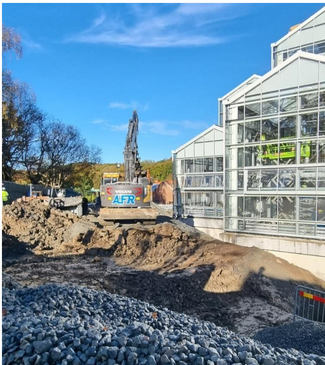
Figur 7 Grovjustering utvändigt

Markarbetena runt om huset fortsätter med både finplanering och grovjustering.