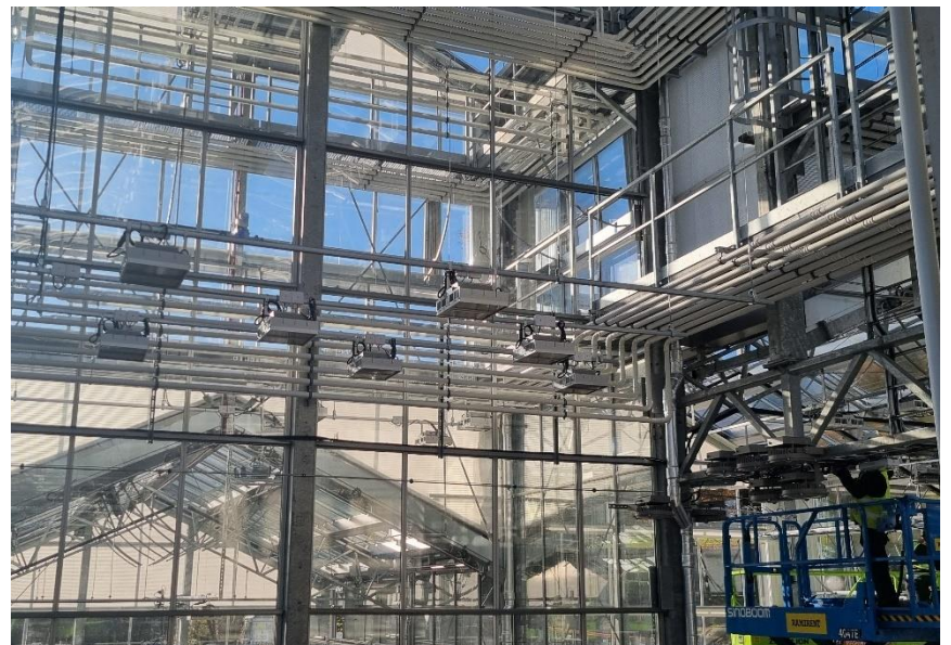
Figur 3. Monterad assimilationsbelysning