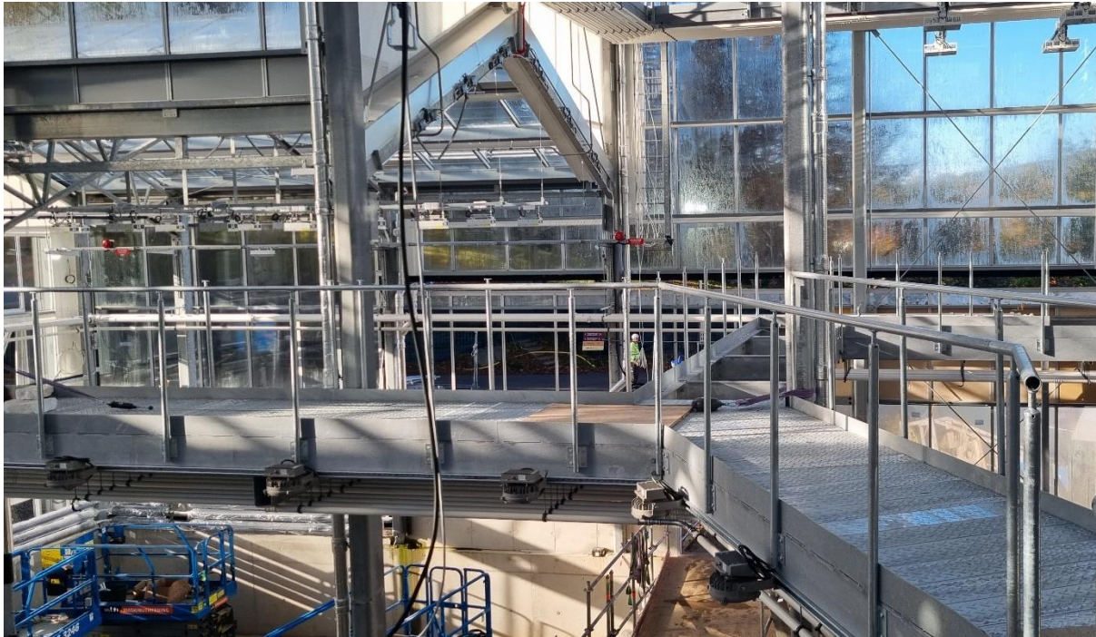
Figur 4. Gångbrygga i djungel/ruin är monterad