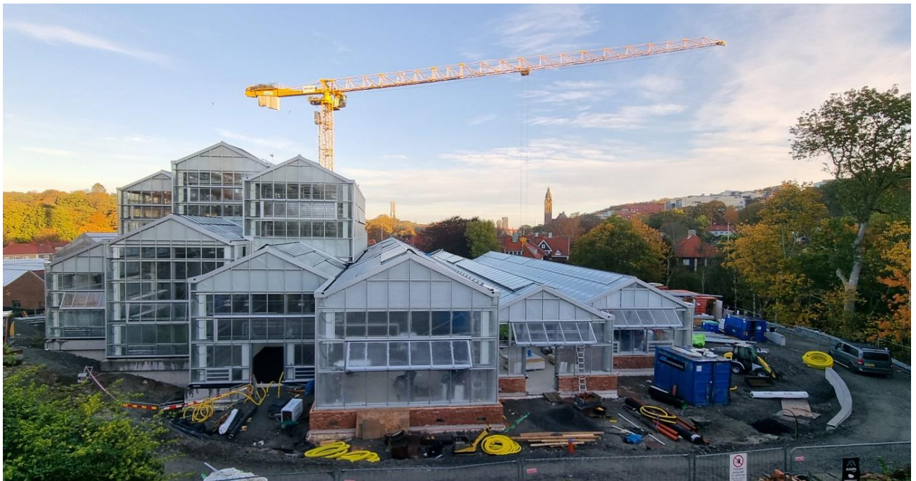
Figur 1. Vy från söder

Växthusmontaget är nu inne på sitt slutskede och det kvarstår endast kompletteringar med tätningar och lister. Även de sista vävarna sätts på plats. I takt med att detta arbete avslutas demonteras också byggställningar och diverse material skickas hem.