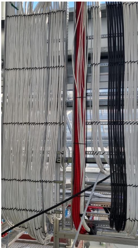
Figur 5. Kablage för diverse installationer

Arbetet med växtbäddar inne i växthusavdelningarna har också påbörjats. Det startas med montage av geomembranet vars syfte är att samla upp lakvatten från växtbäddarna. När geomembran är på plats fylls bäddarna med det växtsubstrat som