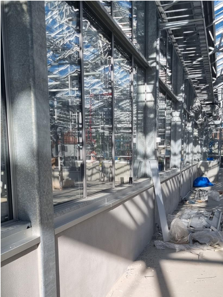
Figur 4. Putsade lecaväggar invändigt har fått plåtdetaljer

De kommande veckorna inleds arbetet med växtbäddar i växthusavdelningarna. Det startas med montage av geomembranet vars syfte är att samla upp lakvatten från växtbäddarna. När dessa arbeten är färdiga påbörjas betongarbeten inne i växthusavdelningarna.