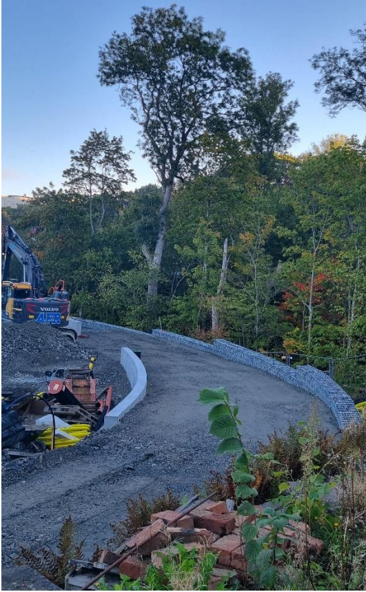
Figur 2. Pågående arbete med gabionmur och ny försörjningsväg

Invändigt är de flesta yrkesgrupperna i full gång i samtliga utrymmen med olika arbetsuppgifter. I vissa avdelningar är man i kompletteringsfasen och avslutar sina arbeten och i andra avdelningar har arbetena nyligen startats upp. Innerdörrar börjar komma på plats och även lås sätts in.