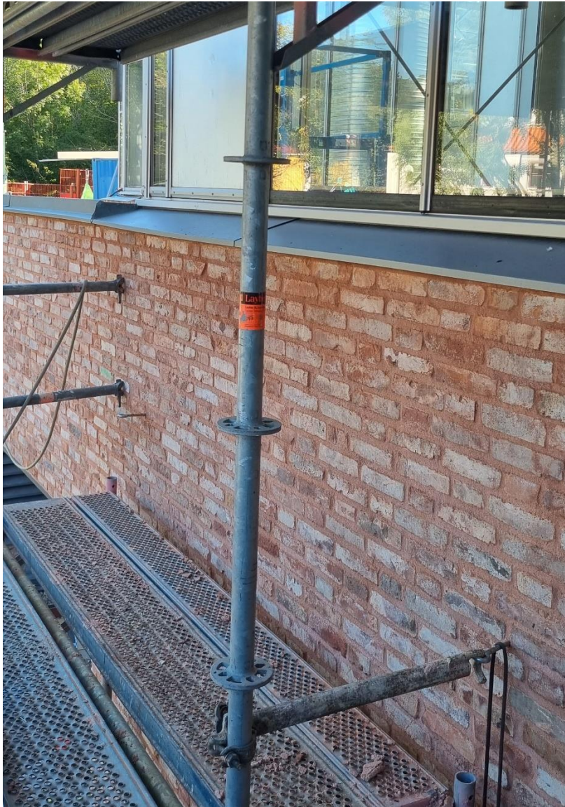
Figur 6. Färdig tegelfasad med plåtbleck på norrsidan