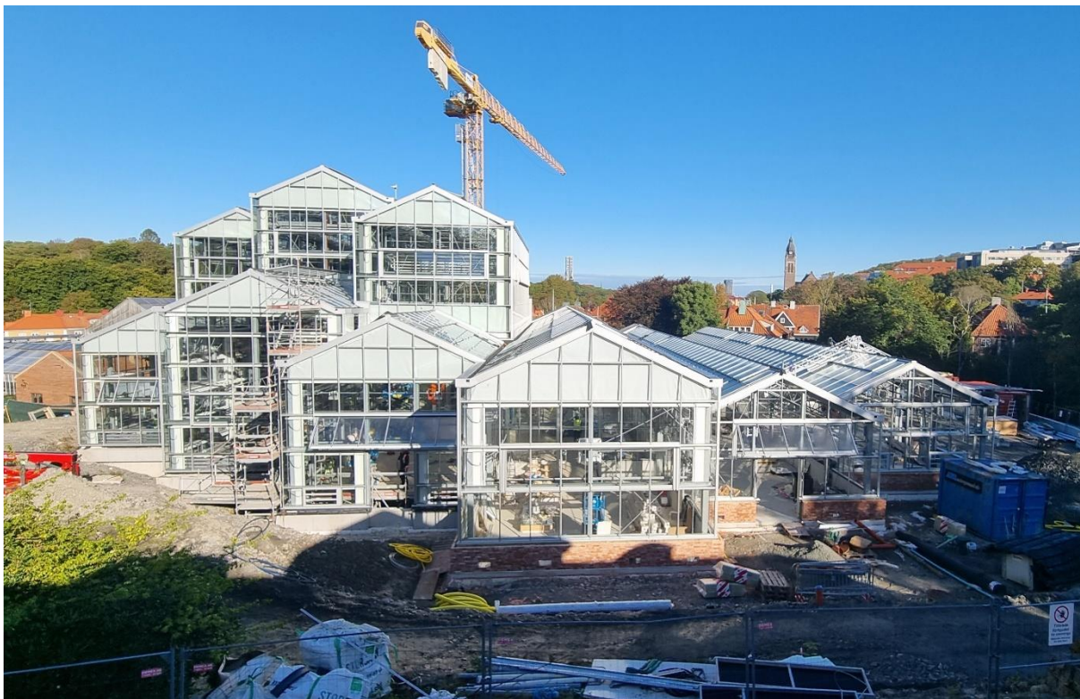
Figur 1. Vy från söder

På östra sidan av växthuset pågår finjustering av marken vilket medför hög frekvens av transporter på Fanny Gréns väg. Även på norrsidan startar man med finjustering inför asfaltering nu när de utvändiga betongarbetena är klara. Arbeten med gabionmur och uppbyggnad av ny försörjningsväg pågår parallellt.