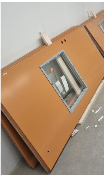
Figur 3. Ytterdörrar som väntar på montage

Invändigt är de flesta yrkesgrupperna i full gång i samtliga utrymmen med olika arbetsuppgifter. I vissa avdelningar är man i kompletteringsfasen och avslutar sina arbeten och i andra avdelningar har arbetena nyligen startats upp. Innerdörrar börjar komma på plats och även lås sätts in.