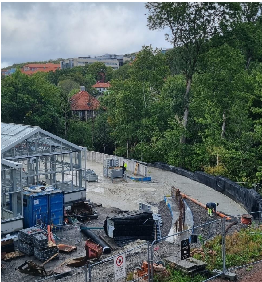
Figur 2. Pågående arbete med gabionmur och ny försörjningsväg