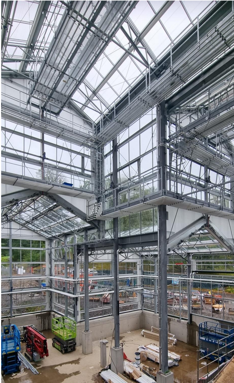
Figur 3. Invändig vy från avdelning djungel & ruin