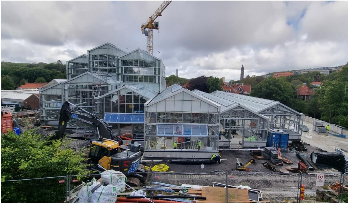
Figur 1. Vy från söder