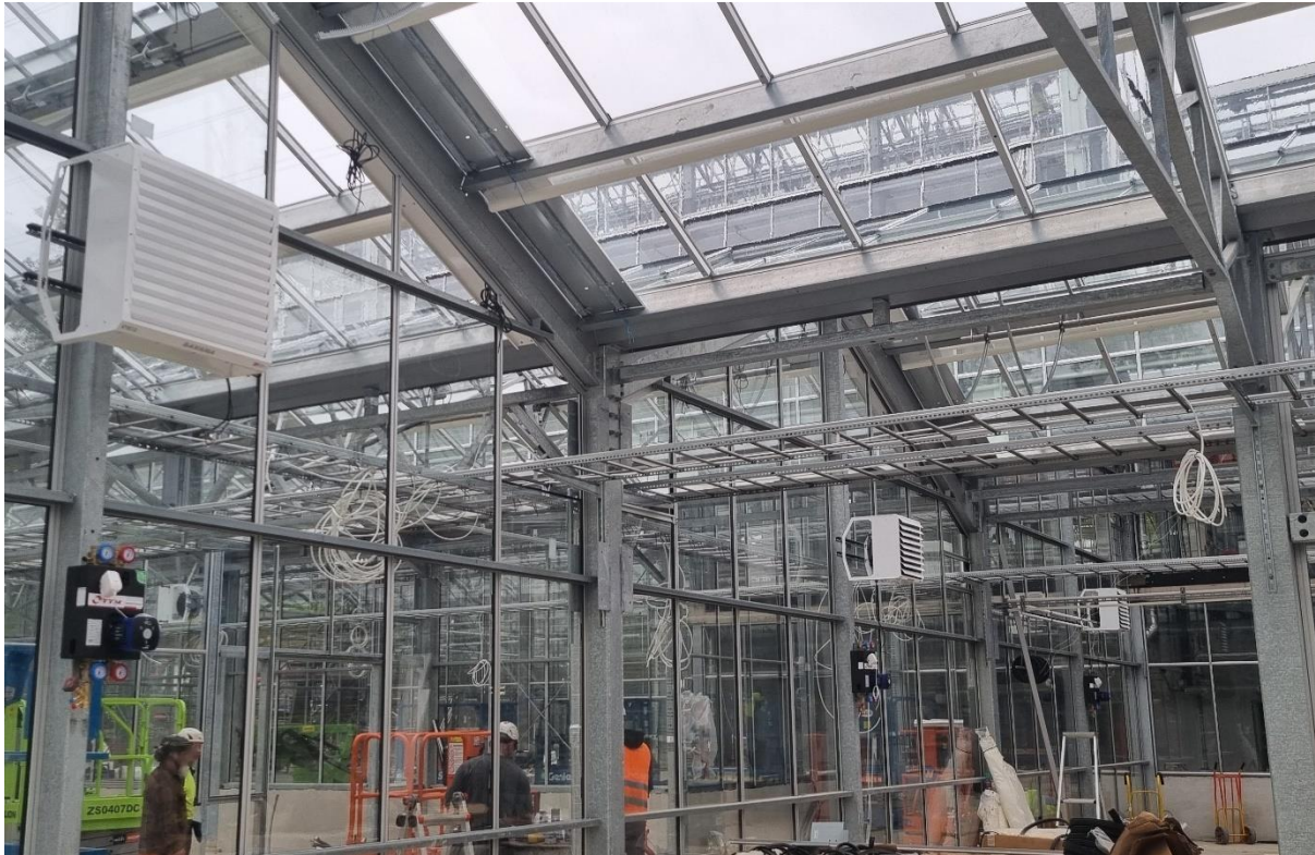
Figur 4. Fläktluftvärmare och shuntgrupper installerade i förökningsavdelning