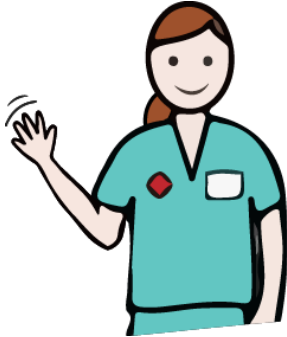
Bild 2: Vem är ansvarig?

Läkarna och sjuksköterskorna på sjukhuset fortsätter att ta hand om din vård.