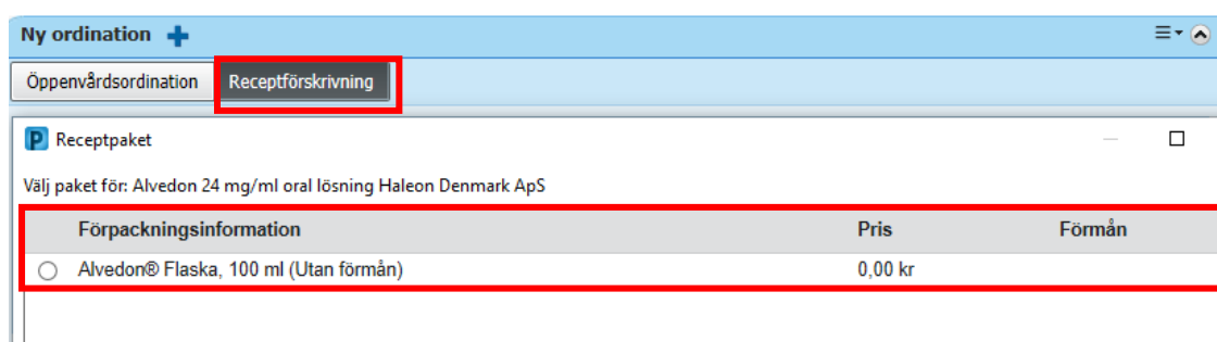
Figur 2. 1: Fliken receptförskrivning 2: Val av förpackning