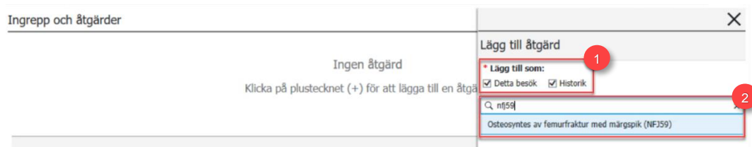
Figur 2. 1: Detta besök och Historik. 2: Sök.