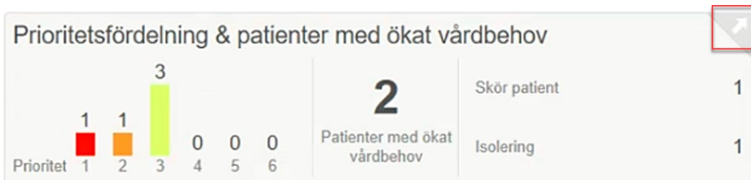
Figur 3. Navigering till detaljerad vy för komponent.