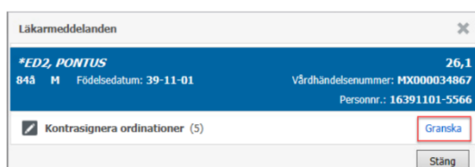
Figur 2. Granska.