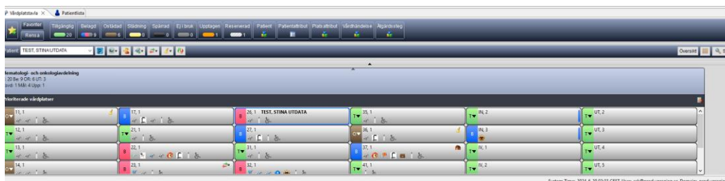
Figur 1. Vårdplatstavla

Byte av vårdplats mellan två patienter kan göras om man vill inom samma avdelning. Bytet görs via Vårdplatstavlån .