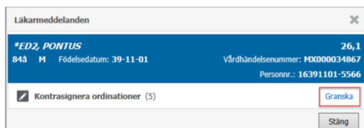
Figur 2. Knappen Granska.