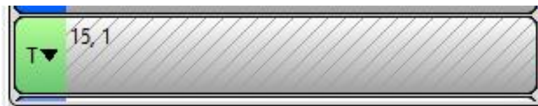
Figur 1. Reserverad vårdplats.