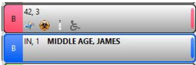
Figur 4. Belagd säng.