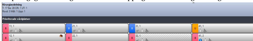
Figur 5 1. 1. Vårdplats med status belagd