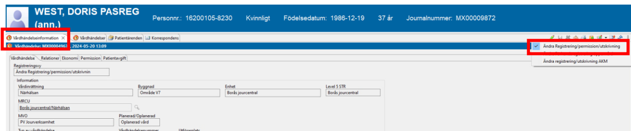
Figur 1. 1. Vårdhändelseinformation, 2. Registreringsvy