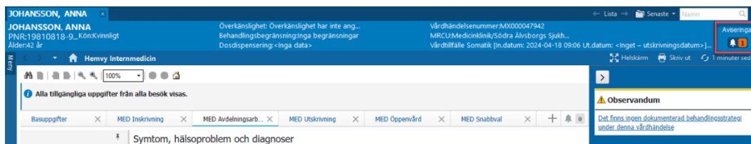
Figur 2. Ikon för UMI/Varningar