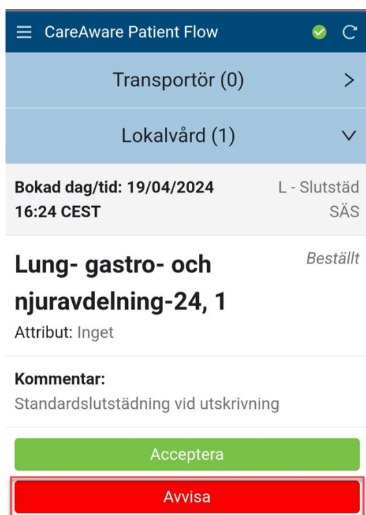
Figur 1. Vy över ett uppdrag i appen. Knappen Avvisa syns inom markeringen.