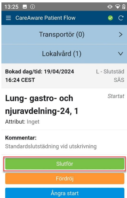
Figur 1. Slutför ett startat uppdrag.