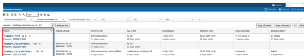
Figur 2. Patientinformation.

Första fältet visar information om patienten. Genom att klicka på patientens namn kommer medarbetaren direkt in i ärendet. Informationen i fältet hämtas från de administrativa modulerna i Patienthanterings-konversationen .