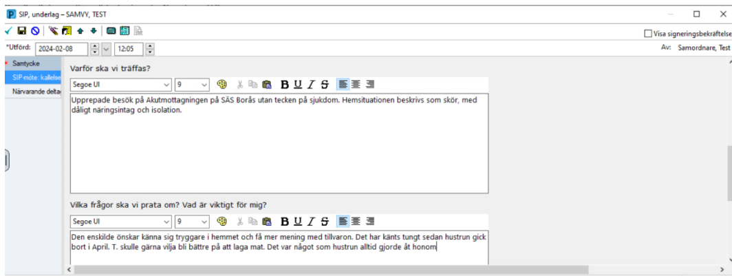
Figur 2. Fritext i SIP, underlag.