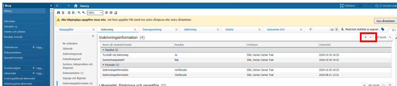
Figur 1 – Öppna formulär Inskrivningsinformation

För att dokumentera trycksår vid in- och utskrivning använder du formulär för inskrivning och utskrivning. I arbetsflödet Inskrivning och komponenten Inskrivningsinformation , klicka på pilen för att öppna formuläret Inskrivningsinformation .