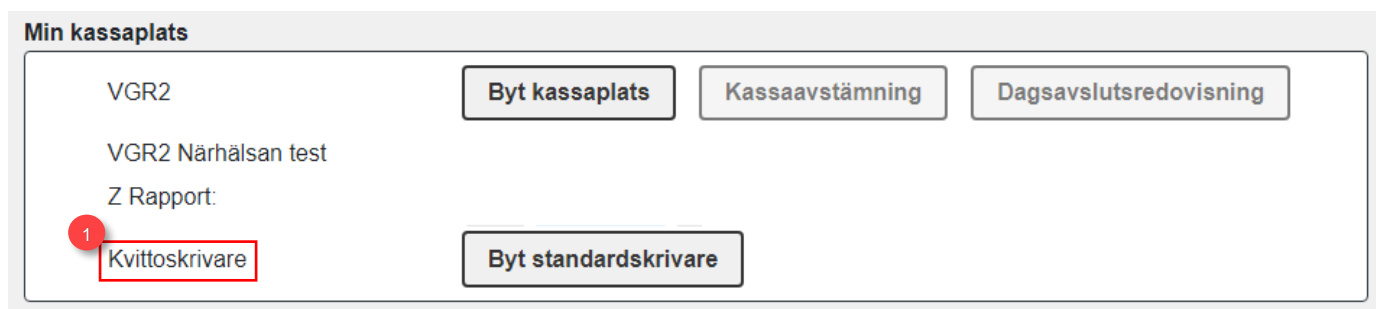
Figur 3. 1: Vald skrivare.